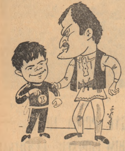
Pescarul!

Ivan Patcoșchin a cucerit la Munchen o medalie de aur și una de argint