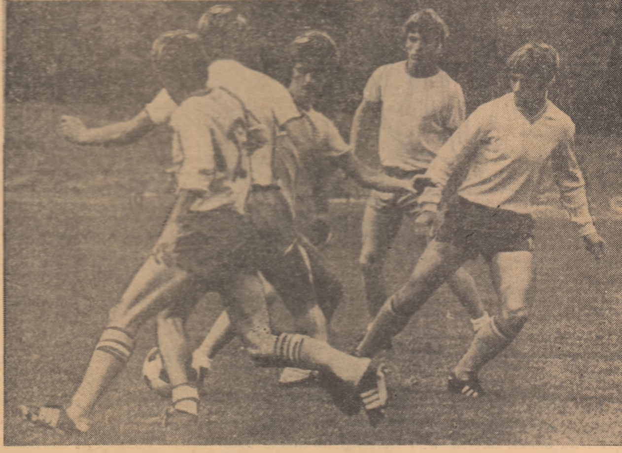
Fază din jocul-școală susținut ieri dimineață de tricolori în compania echipei de tineret Dinamo

● Portarul pitestean Stan a fost chemat în lot, în locul lui Adamache ● Dobrin, Dembrowschi și Deleanu s-au accidentat și refacerea lor în timp util este incertă