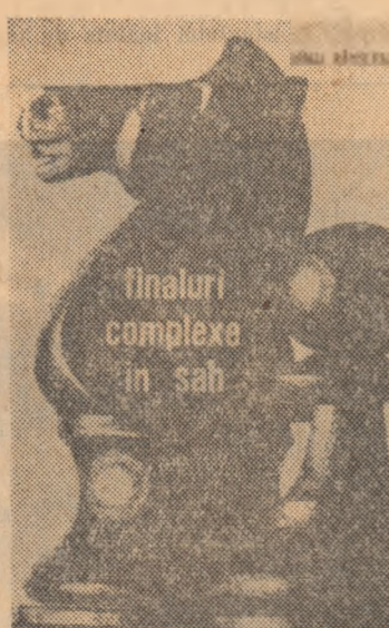
Finaluri complexe în șah

pra unor „finaluri“, oferind o autorizată „introducere“ în acest important capitol al jocului de șah. Dar, pentru a nu răpi cititorilor plăcerea analizei unor interesante noastre prezentare, cu specificația că Editura Stadion, prin publicarea acestui volum răspunde interesului tot mai crescînd al publicului pentru acest sport al minții