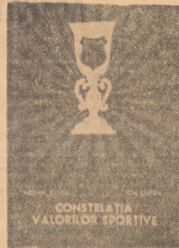
CONSTELAȚIA VALORILOR SPORTIVE

Comentariile pe marginea „meciului secolului“ dintre marii maeștri Fischer și Spasski nu s-au sîns încă în rîndul iubitorilor șahului. De aceea, considerăm oportuna apariția în acest moment a volumului „Finaluri complexe de șah“ semnat de Mihai Rădulescu, care oferă celor interesați noi repere în analiza partidelor din această interesantă confruntare, dar, în primul rînd, posibilitatea ridicării nivelului de cunoștințe de specialitate. De altfel, după cum