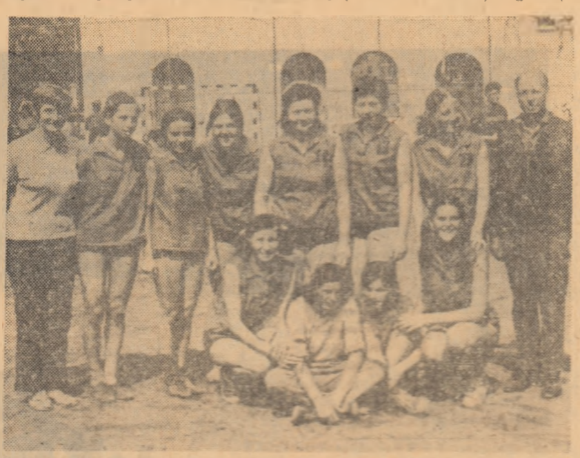
Echipa campioană sătească, Recolta Ditrău, la câteva minute după meciul decisiv, susținut în compania formației Recolta Rod.

populare, dezvoltându-se și cițiva jucători (Gh. Belu, O. Teodorescu, P. Ghiță, V. și Gh. Iancu, V. Burlacu) capabili, în perspectivă, să abordeze