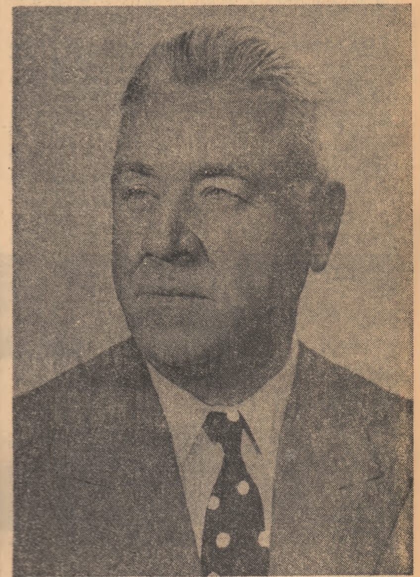
Mult iubite tovarăse Maurer.

Ne este deosebit de plăcut ca, la împlinirea vîrstei de 70 de ani, să-ți aducem un fierbinte salut tovarășesc din partea Comitetului Central al Partidului Comunist Român, a Consiliului de Stat și a Consiliului de Miniștri, să te felicităm din toată inima și să-ți adresăm cele mai bune urări de sănătate, viață lungă și fericire.