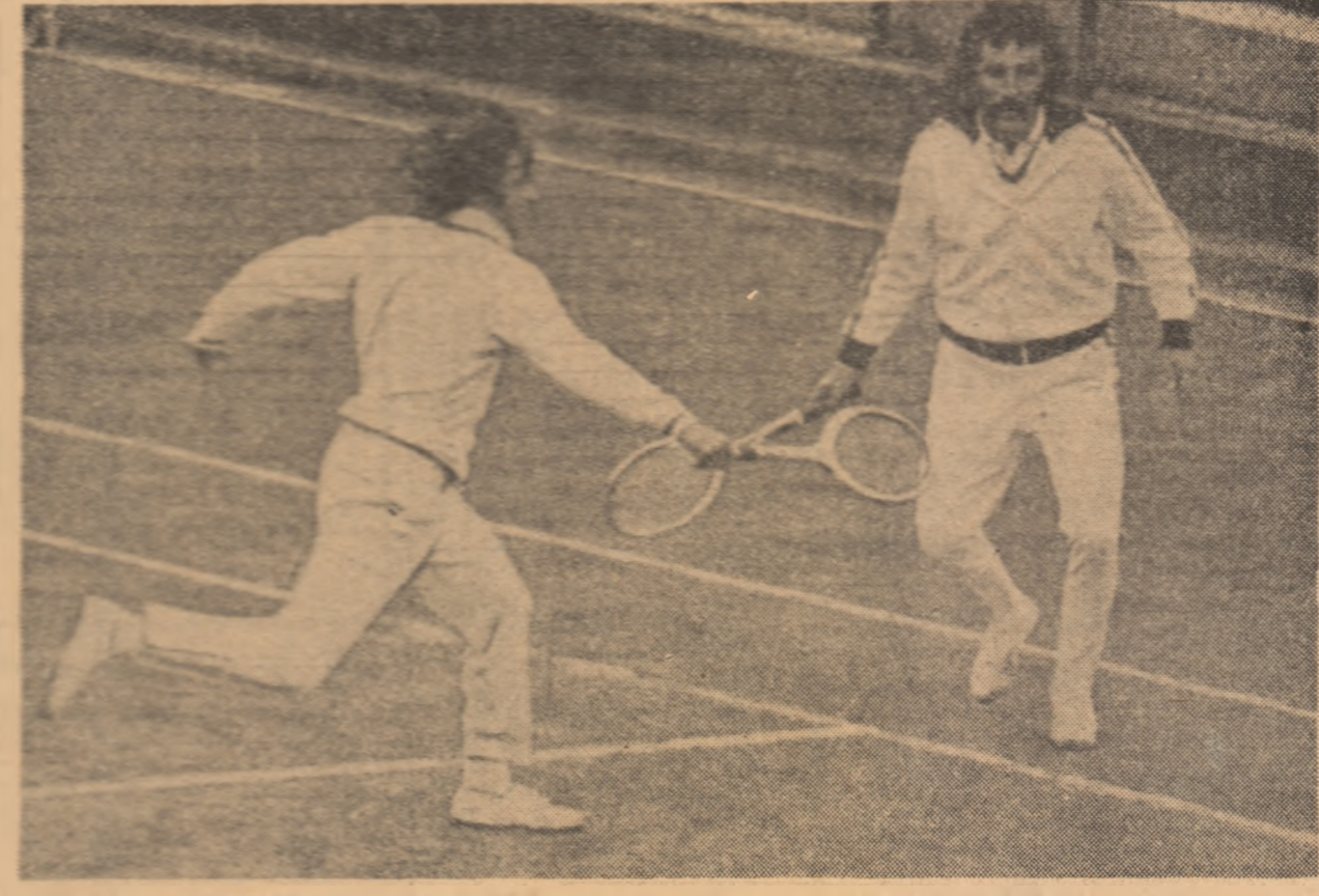
Evoluția excelentului cupiu Ilie Năstase — Ion Tiriac va cîntări, desigur, mult în balanța înfîinirii