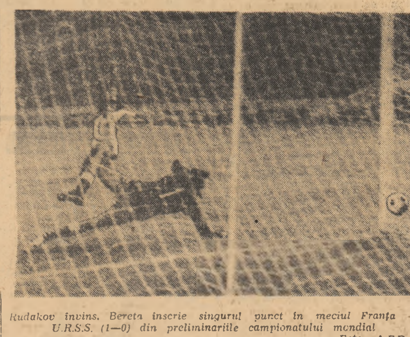
Rudakov învins. Bereta înscrie singurul punct în meciul Franța U.R.S.S. (1-0) din preliminarie campionatului mondial.