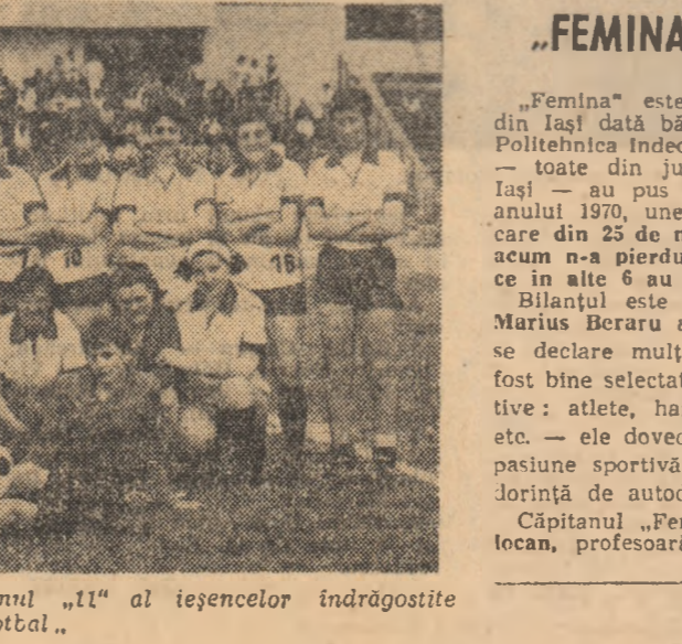
Această este echipa „Femina”, primul „11” al ieșencilor îndrăgostite de fotbal.