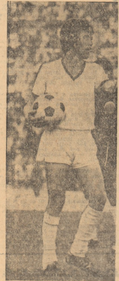
Fericit, de invidiat, sint soccraerere in care „omul de gol” tro-nează într-o domnie de mai lungă durată, lipsit de griji. Se trece, de pildă, la alchimia „11” lui Vest-german. Cine să-i ia sceptrul lui Müller? Se forma naționala Braziliei, cul altuia decât lui Pele și revenea tricoul virfului de atac? Acum problema o rezolvă Tostao. Fericit sint aceste soccrae dar și... putine, ele constituindu-se în ex-cepții, intrucit, astăzi în lumea fotbalului, virfurile de atac veritabile sint o rara avis sau simple comete