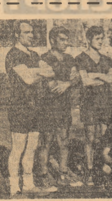
Din planul noii societăți: activitate sportivă în atletism, box, lupte, handbal și fotbal.