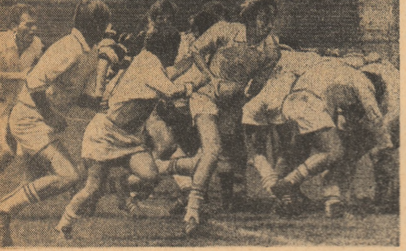
Bucos (cu balonul), unul dintre aspiranții la un loc în echipa reprezentativă.

LOTUL REPREZENTATIV ÎȘI REIA LUNI PREGĂTIRILE