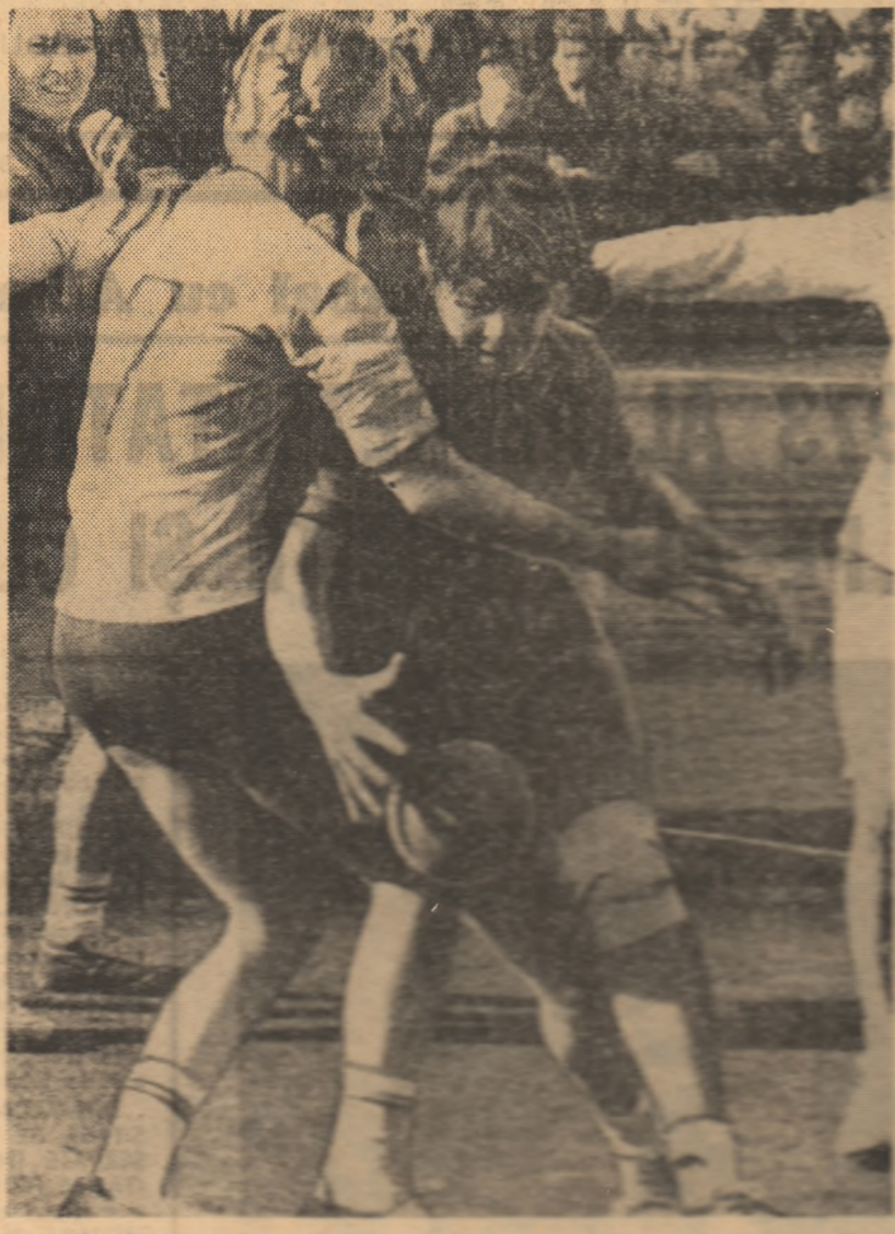
Fază din derby-ul feminin Steaua - Dinamo București. În fundal: Dinamo București și Steaua București.