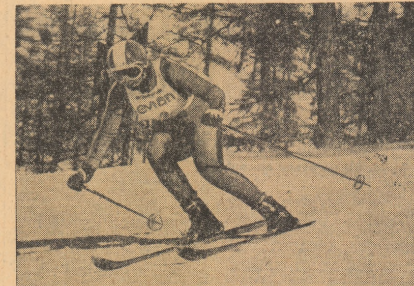
Definitoarea Cupei mondiale la schi, Annemarie Proell, intr-una din victoriasele ei coboriri.