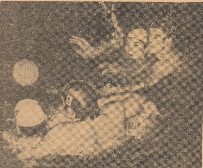
Imagine din ultima partidă Dinamo — Rapid, desfășurată în cadrul turneului final al campionatului național

Ce va fi o vitătoare adversitate ale echipelor dinamoviste? Partizan, în a cărui slăbire intră 7 olimpici iugoslavi (Janković,