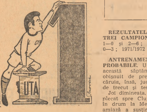
Cu postamentul ăsta, cu năpoca de șansă, poate reușesc să mă urc!!!