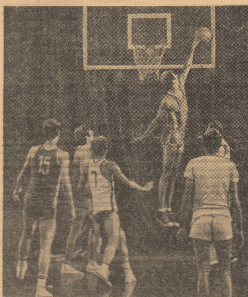
Blocaj regulamentar la minge, temă exersată la ultimul antrenament al echipei Dinamo