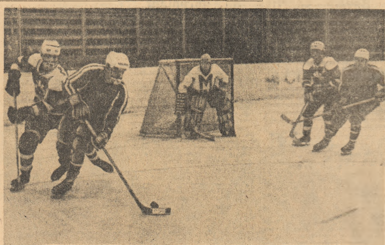
Atacul Stelei încearcă să desfacă prin pase rapide apărarea echipei din Miercurea Ciuc.