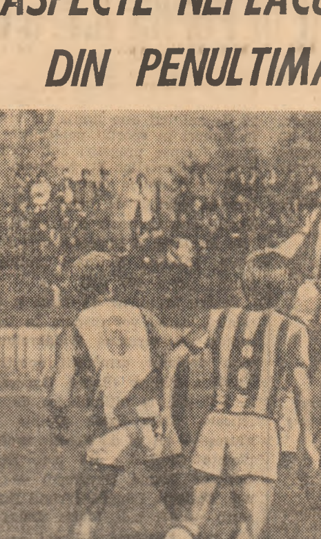
Un joc dirz disputat, echilibrat, de bună factură tehnică a fost și meciul Unirea Tricolor București—Olimpia Giurgiu (1-0).