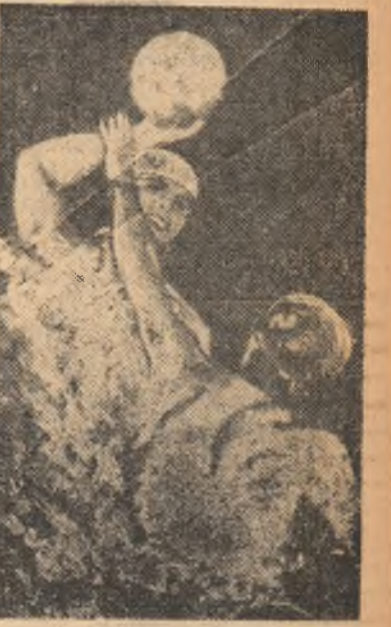
Fază din meciul dintre Rapid și Dinamo, două echipe care au demonstrat frumusețea jocului de polo atunci cînd întrecerea este echilibrată.

plecînd de la premisa că avînd un campionat puternic cu mai multe echipe redutabile, care să participe în mod efectiv la lupta pentru titlu