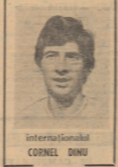
internațional CORNEL DINU

1. La prima întrebare, răspunsul este fără echivoc. Am jucat slab. Nu îmi aduc aminte să fi jucat atât de slab de patru ani, adică de la Lisabona 1968, când am pierdut cu 0-3.