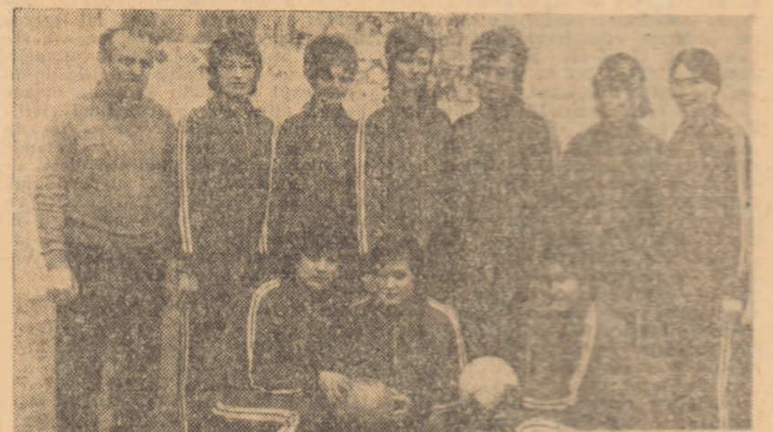
Echipa feminină de volei Corvinul Deva, care activează în divizia B.