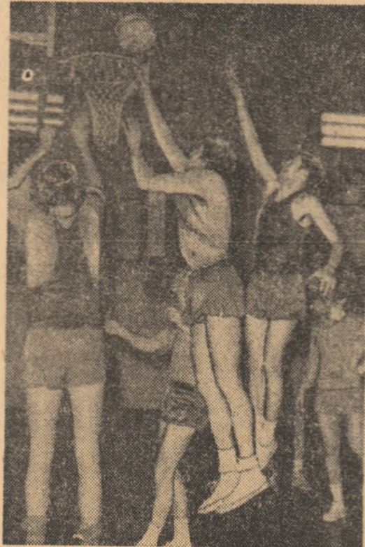
Ieri, la ultimul antrenament al steiștilor, aruncări la coș și recuperări

singură înfrîngere, în fața formației Maccabi Tel Aviv. Formații: STEAUA (între paranteze, numărul de pe tricou): Tarău (4), Grădîșteanu (5), Baciu (6), Savu (7), Pîrsu (8), V. Gheorghie (9), Poleanu (10), Dimancea (11), Dumitru (12), Ozelele (13), Ronav (14), Ionescu (15); MACCABI: Bartie (4), Levin (5), Ben Ari (6), Kaminski (7), Kohen (8), Mozeș (9), Zilberman (10), Mendes (11), Hill (12), Gordon (13), Newmark (14), Waxman (15). Arbitri: P. Evangelatos (Grecia) și G. Pschera (Austria).