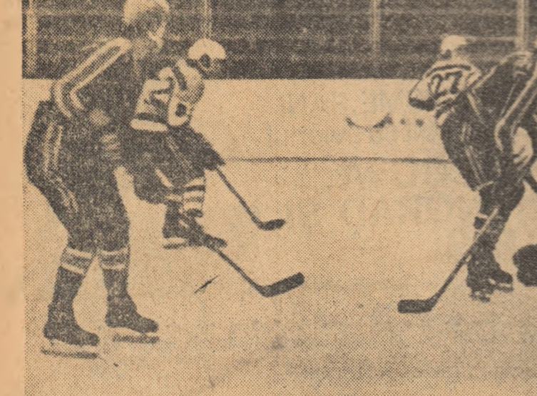
Portarul Orban (Tirnavă), aflat ieri în zi foarte bună, respinge un atac al hocheiștilor de la Agronomia.

Tot la Pilsa s-a disputat și un mare concurs internațional cu participarea sportivilor din 11 țări