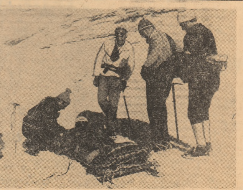
lucrul în zona dintre cabanele Bilea Lac și Sîrului au fost generate, în mare parte, de marșurile insuficient de sigure. „La săptămîna după accidentul din august am urcat pe o vreme vitregă, cîmnea Făgărașului cu cîțiva membri ai cercului „Amicii muntelui” pentru a face cîteva completări și corectura ce se impunea în marșul din acea zonă”.