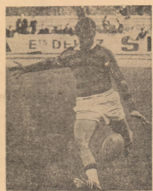
CAMPAES — o aripă în a cărei reintrare în echipa Franței se pun mari speranțe.

Acastă formație, destul de puternică, pare a fi bine primită de opinia publică, cași de critica spor-