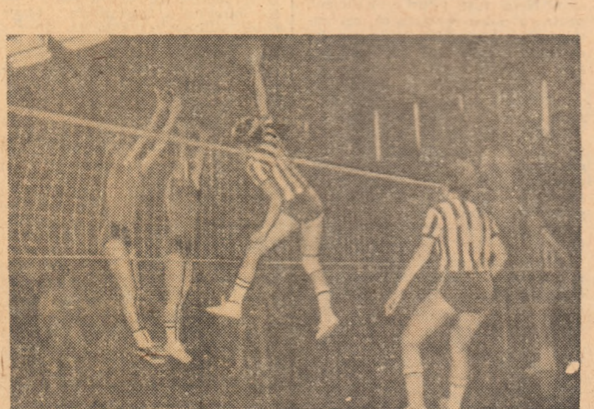
Blocajul echipei Penicilina Iași încearcă să respingă atacul voleibalistelor de la Rapid (tricouri în dungi).