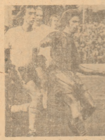
O fază obișnuită. Gerd Müller, față în față cu portarul advers marchează un nou gol pentru echipa sa, Bayern München, așa cum s-a întâmplat și în partida derby, cu Fortuna Düsseldorf.

În etapa a XIV-a a campionatului vest-german s-a desfășurat partida derby, dintre primele două clasate: Bayern — Fortuna Düsseldorf, câștigată de gazde cu 3-2, după ce în repriza secundă oaspeții conduceau la un moment dat cu 2-0! Pentru Bayern primul gol l-a marcat Müller, apoi Beckenbauer a egalat și tot el a înscris golul victoriei. În urma acestui rezultat, formația bavareză conduce din nou detasat avînd 23 p., fiind urmată de Fortuna Düsseldorf cu 19 p. și F.C. Köln cu 18 p. Alte rezultate ale etapei: Wuppertaler S.V. — VfB Stuttgart 4-0, Hertha — M.S.V. Duisburg 0-0, F. C. Köln — Eintracht Frankfurt 3-1, Schalke 04 — Borussia 2-2.