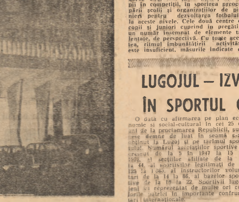
Sala Olimpia, una dintre cele mai importante construcții sportive din anul Republicii, se numără, fără îndoială, printre pisele de rezistență ale noii arhitecturi ale orașului de pe Bega. Dotată cu amenajări moderne, ea a găzduit competiții de mare însemnătate, între care Campionatele Bulgarice de gimnastică, „Trofeul Carpați” la handbal, ca să nu mai vorbim de întrecerile competiționale duminicale, urmărite cu interes de timișoreni.