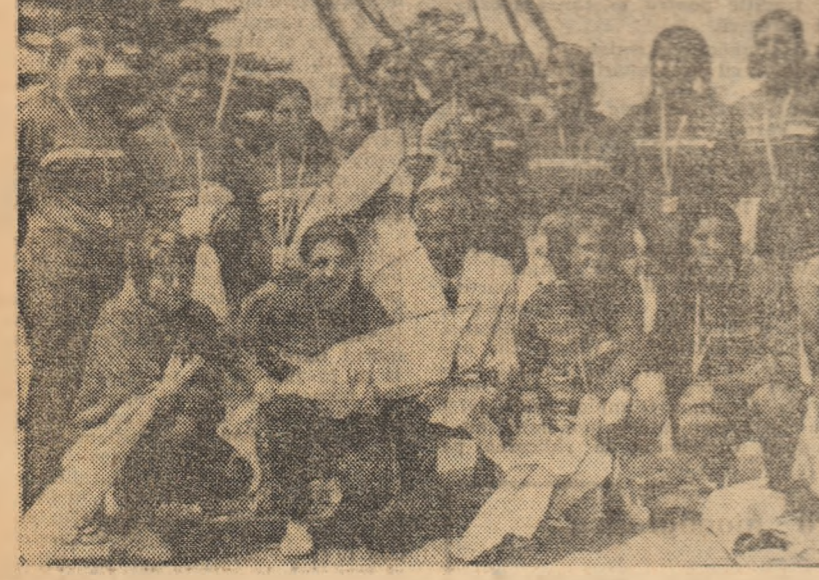
Din nou campioană a României — echipa de handbal feminin Universității Timișoara

În societatea noastră sportul reprezintă un factor important în dezvoltarea fizică și intelectuală a tinerilor. Este o modalitate de educație a voinței și caracterului, dezvoltare a gândirii și activității fizice, mijloc de cunoaștere a lumii și de afirmare a valorii omului. Sportul este o activitate care contribuie la formarea unor specialiști în domeniul sportului de performanță. În societatea noastră sportul reprezintă un factor important în dezvoltarea fizică și intelectuală a tinerilor. Este o modalitate de educație a voinței și caracterului, dezvoltare a gândirii și activității fizice, mijloc de cunoaștere a lumii și de afirmare a valorii omului. Sportul este o activitate care contribuie la formarea unor specialiști în domeniul sportului de performanță.