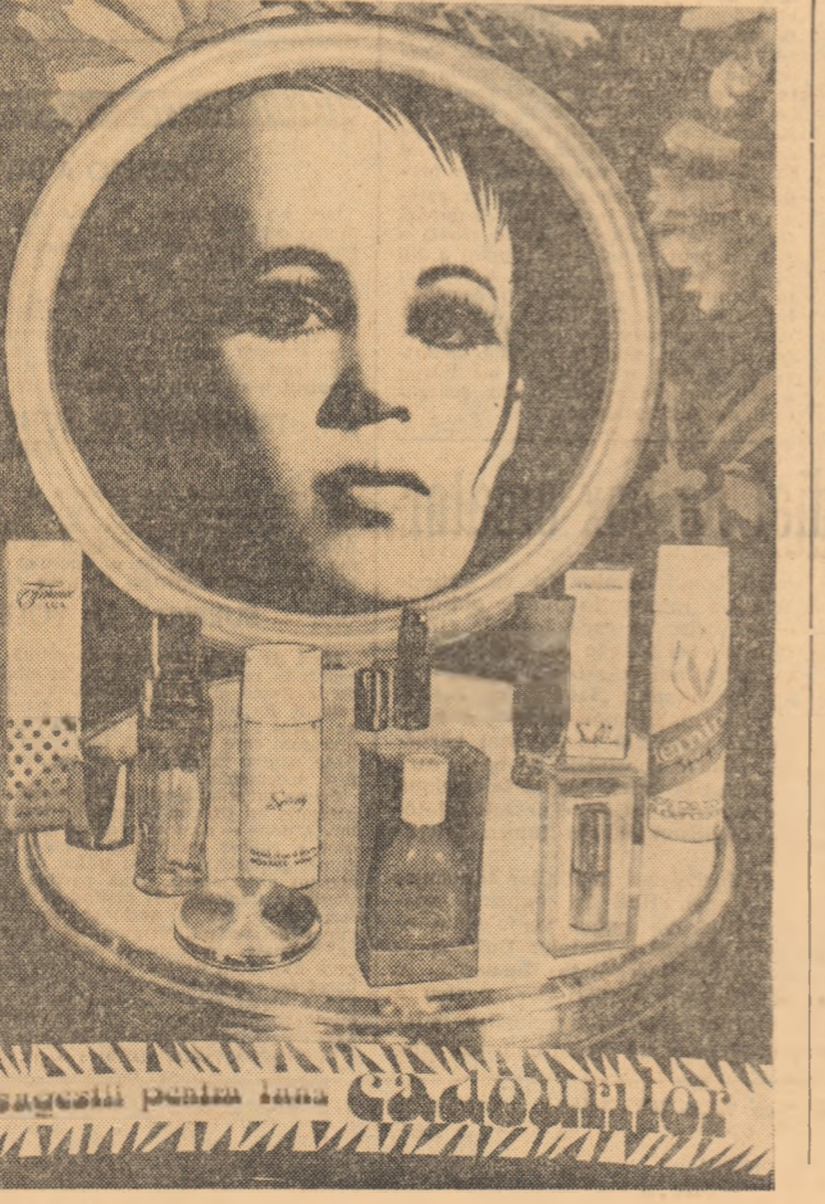
Sugestia pentru luna...