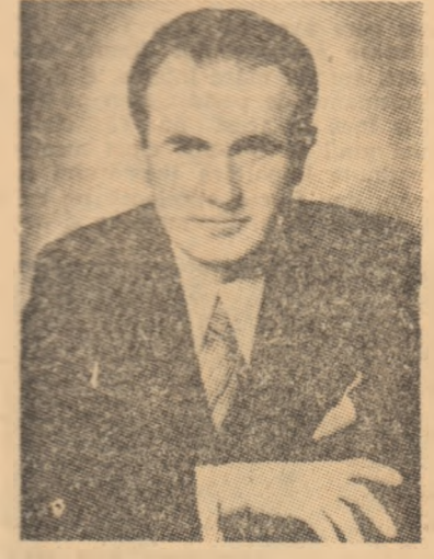
„Cronicar sportiv“ N. Grămățic, pe care istoria literaturii române îl menționează — uneori — ca fiind... CAMIL PETRESCU!

Pe masa de lucru, fișele documentare s-au așezat în ordinea mărimii (decomandată), așteptând semnul care le va reda trînzura... • Ce considerăm de, ca este sportul?... • Chiar când este vorba de un... balon românesc?