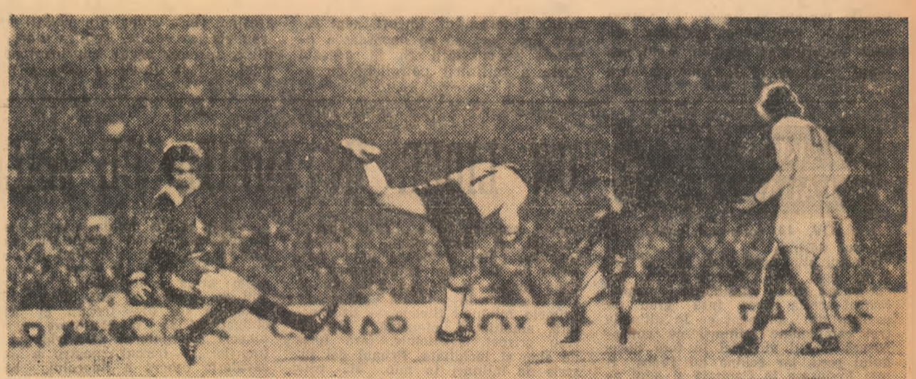
Intr-un meci cu goluri multe în poarta sa, portarul echipei F.C. Köln reușește - de această dată - să oprească un atac al Borussia Mönchengladbach.