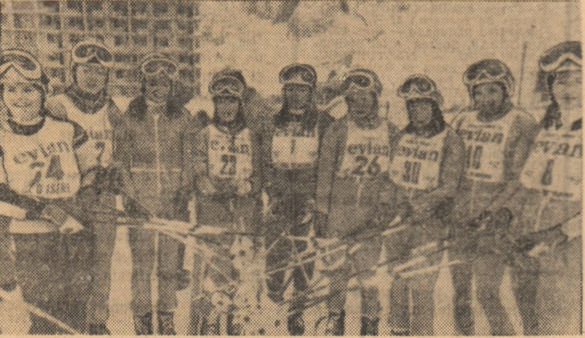
Echipa feminină de schi alpin a Austriei a atacat ferm sezonul de iarnă...