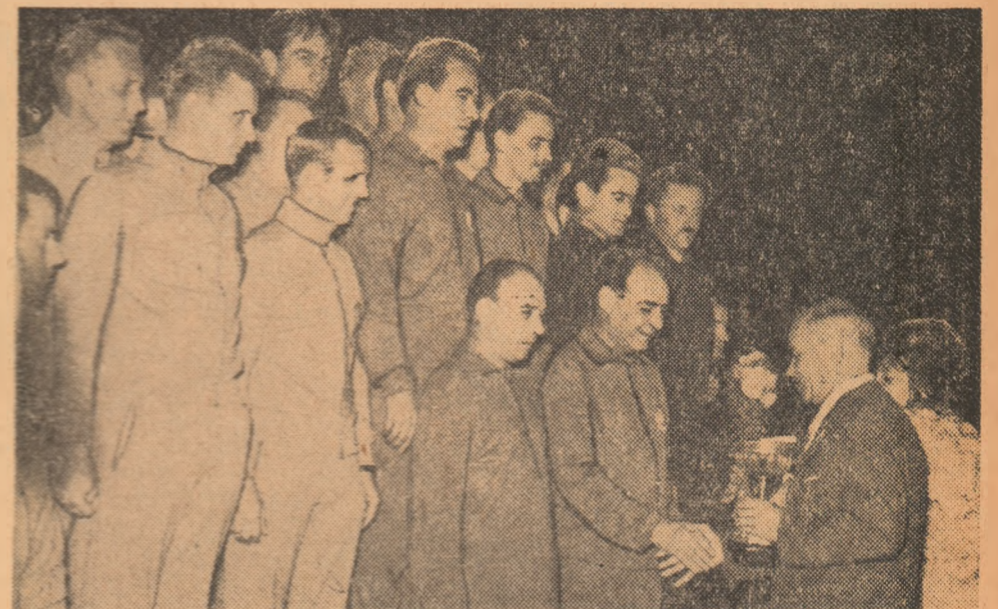
Un moment de neuitat: președintele F.I.P., Adolf Oesch înmîină cupa și medalia de aur echipei masculine a României (încadrată de formațiile R.D. Germane și Iugoslaviei pe podiumul premiaților), cîștigătoare C.M., ediția 1966.

● 10 titluri mondiale, două europene și numeroși medaliați cu argint și bronz ● 62 de maeștri și maeștri emerși ai sportului ● România ocupă un loc de frunte în forul internațional de specialitate ● Aproape 100 000 de practicanți și peste 30 000 de sportivi legitimați.