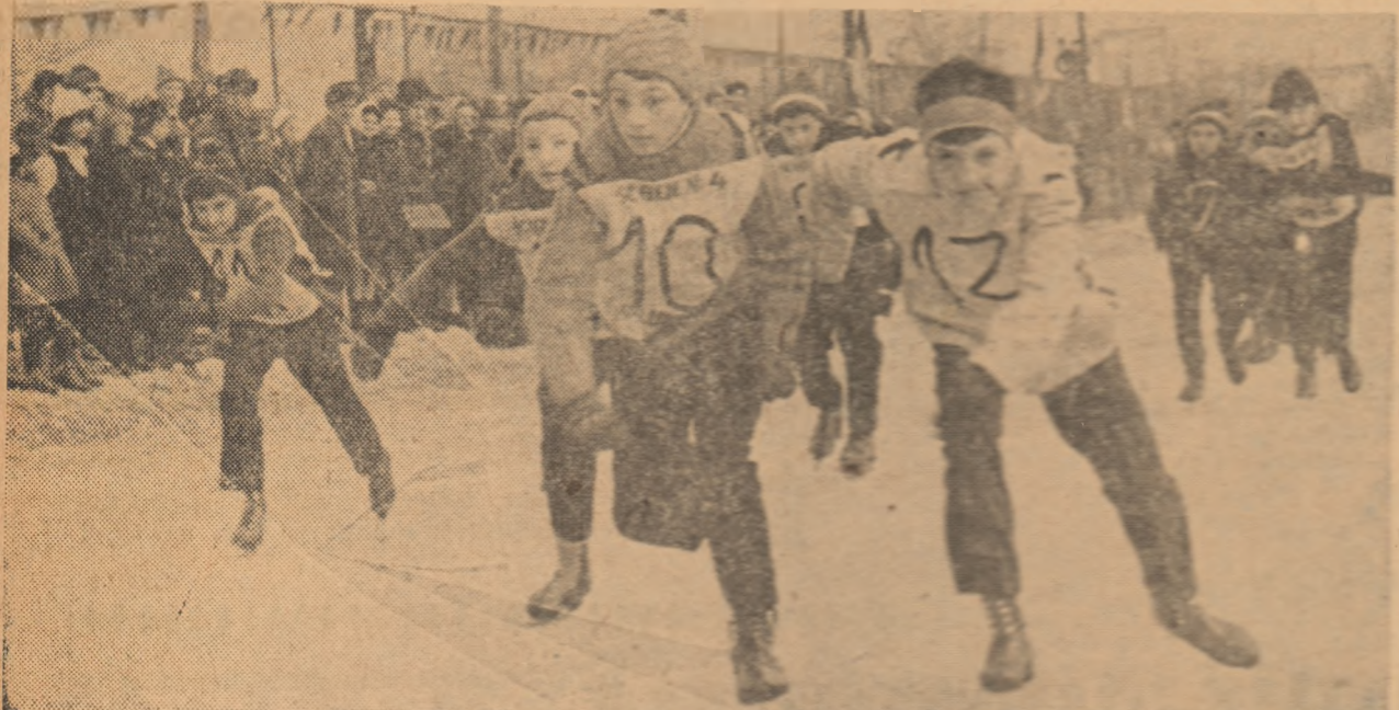
In multe din taberele sportive ale vacanței, patinajul se situază la prima planșă preocupărilor elevilor și studenților. Iată o imagine surprinsă la Cimpulungul Moldovei: un concurs de patinaj artistic desfășurat pe stadionul pitorescul oraș din nordul țării.

Separat elevii și studenții din partea noastră beneficiază de tabere de odihnă. La acest capitol cifrele sunt substanțiale sportive, de ordinul zecilor de mii anual. Taberele de odihnă ale vacanței sunt, evident, și ele un prilej de a practica exerciții fizice, unele sporturi preferate, dar într-un regim diferentiat, cu o intensitate de efort mult mai redusă. Eficiența taberelor sportive ale vacanțelor nu mai necesită sublinieri. Condițiile optime în care elevii și studenții se recrează și se perfecționează totodată, îi aduc în situația fericită ca o dată reveniți în școală sau facultate, a-