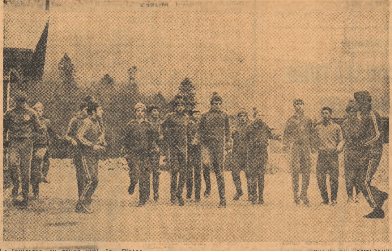
La întoarcere, cu grupa prof. Ion Pinte...

Indreptându-ne spre sala de atletism „23 August”, care găzduia primul concurs de atletism al anului, sub egida comisiei municipale și dedicat juniorilor II și copiilor, ne reaminteam că exact acum un an, același concurs — organizat atunci, de Școala sportivă „Viitorul” — nu beneficia de moderna bază pusă la dispoziția atletismului bucureștean, micii concurenți înghesuindu-se (cei erau câteva sute) într-o sală