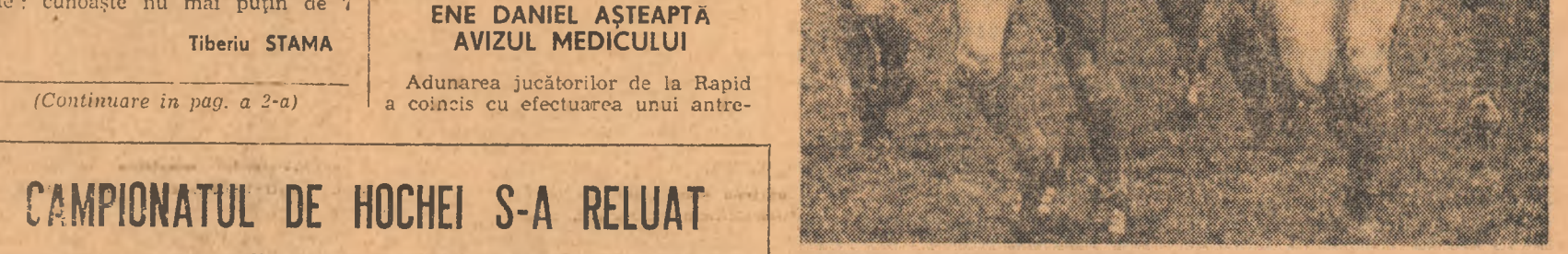
Imaginea aceasta a fost surprinsă la ultimul antrenament al fotbalistilor de la Steaua la sfîrșitul sezonului trecut. De atunci nu trecut trei săptămîni. Zile de odihnă, zile de speranță. Astăzi jucătorii militari au pășit în noul sezon cu ședința de pregătire de la Stadionul Gheena.