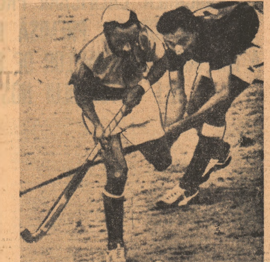
Imaginea reprezintă un moment al uneia dintre pasionantele finale olimpice, care au opus descoperite selecționatele Pakistanului și Indiei

Medaliați cu argint în 1964, la Tokio, pakistanezii aveau să ajungă din nou pe cea mai înaltă treaptă a podiumului patru ani mai târziu, la Ciudad de Mexico, ducând pentru a doua oară titlul suprem în patria lor. (München, pakistanezii au pierdut 0-1 în