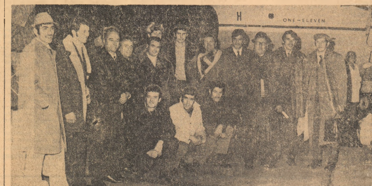
Imediat după coborîrea din avion, handbaliștii noștri surîd în fața obiectivului aparatului de fotografiat. Formația universitară a României este campioană mondială!

DÜSSELDORF, 8 (prin telex). În localitatea Offenburg, din apropierea orașului Freiburg (R.F.G.), a avut loc un mare turneu internațional de handbal, la startul căruia s-au prezentat unele dintre cele mai bune formații de club din Europa (Partizan Bjelovar, M.A.I. Moscova, F. a. Göttingen, Steaua București). Manifestînd o formă excelentă, handbaliștii de la Steaua au cîștigat turneu, învingînd în finală pe Partizan Bjelovar, deținătoarea C.C.E., cu scorul de 14-10 (8-6).