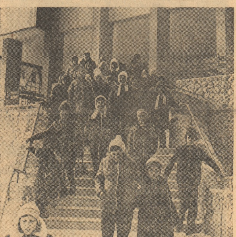
Predeal. Cu schiuri și... voie bună, în căutarea zăpezii!