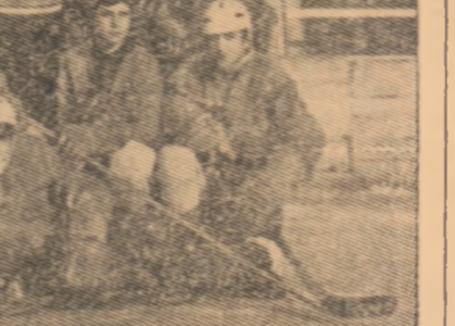
LA VATRA DORNEI — PIRTIA PIONIERILOR

Un grup de tineri, membri ai cercului de turism „Dor de ducă” de pe lângă Asociația sportivă „Utilajul” Făgăraș, a ținut să cinstească istoricul act al proclamării Republicii muntin pe Virful Omul (2507 m) o placă comemorativă cu inscripția: „30 decembrie 1947 — 30 decembrie 1972. În cinstea celui de al XXV-a aniversării a proclamării Republicii Socialiste România...”