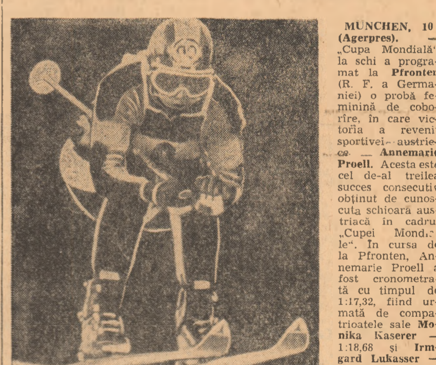
Austria Annemarie Proell, în timpul probei de coborîre de la Pfronten, pe care a cîștigat-o într-o manieră spectaculoasă.