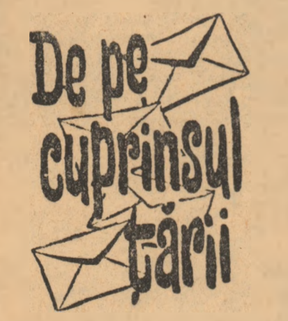
De pe cuprinsul țării