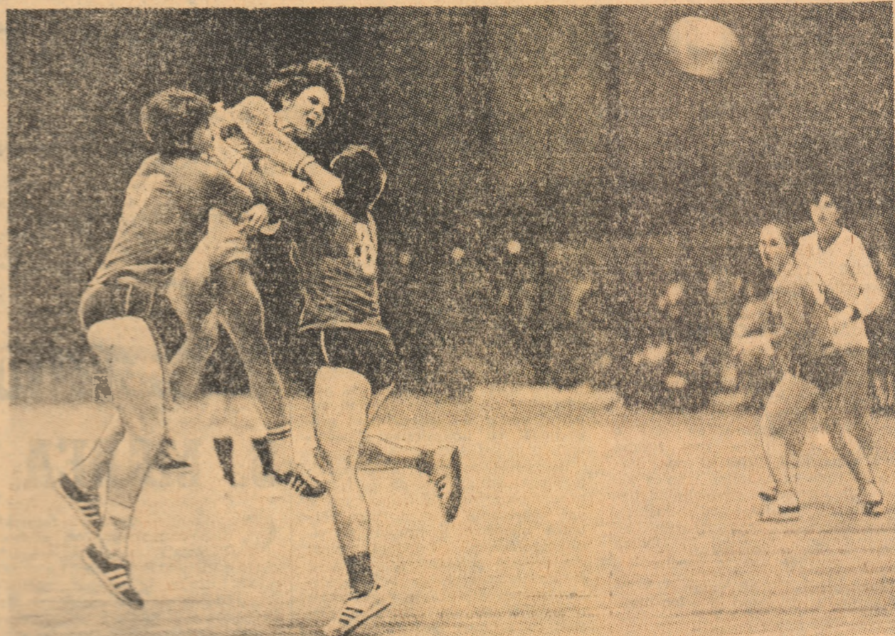
Imagine dintr-un meci disputat în acest an între reprezentativele feminine ale U.R.S.S. și României.

Echipa României pe locul IV, datorită unui bun final de sezon