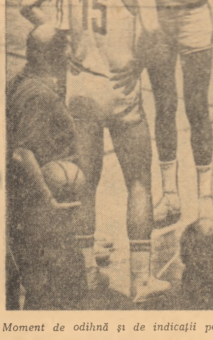
Moment de odihnă și de indicații pentru baschetbaliștii de la Dinamo