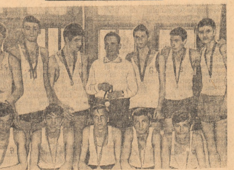
Baschetbaliștii liceului „Ion Luca Caragiale“ din București, de patru ori câștigători ai campionatului municipal