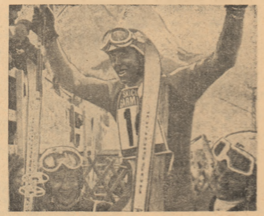
Ciștigătorii ultimei probe de coborire din cadrul „Cupei mondiale” de schi, de la Garmisch-Partenkirchen: elvețianul Columbian (la mijloc), italianul Varallo (stînga) și elvețianul Rusi (dreapta).