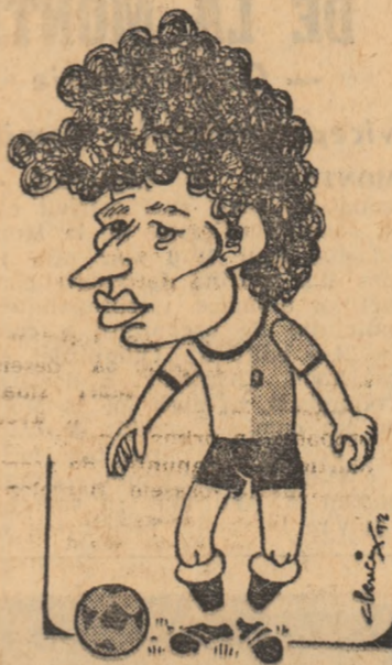
MULȚESCU Desene de AL. CLENCIU