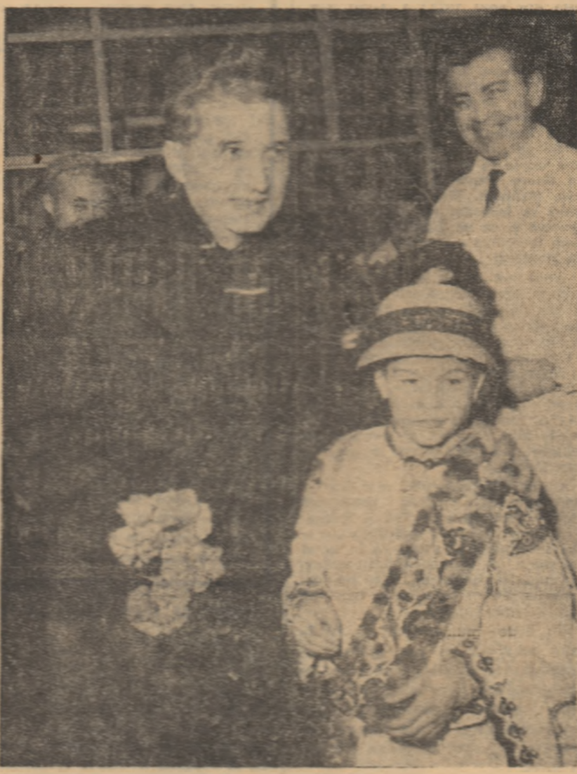
Dragoste părintească pentru generațiile tinere.

Cea de-a doua zi a vizitei de lucru a tovarășului Nicolae Ceaușescu în Capitală a început cu Institutul central de cercetări chimice — unitate care coordonează întreaga activitate de cercetare științifică din domeniul chimiei, desfășurată în institute și centre de cercetare, laboratoare uzinale și