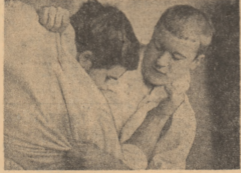
Campionul european Alexei Volosov (dreapta) la antrenamentul de ieri.