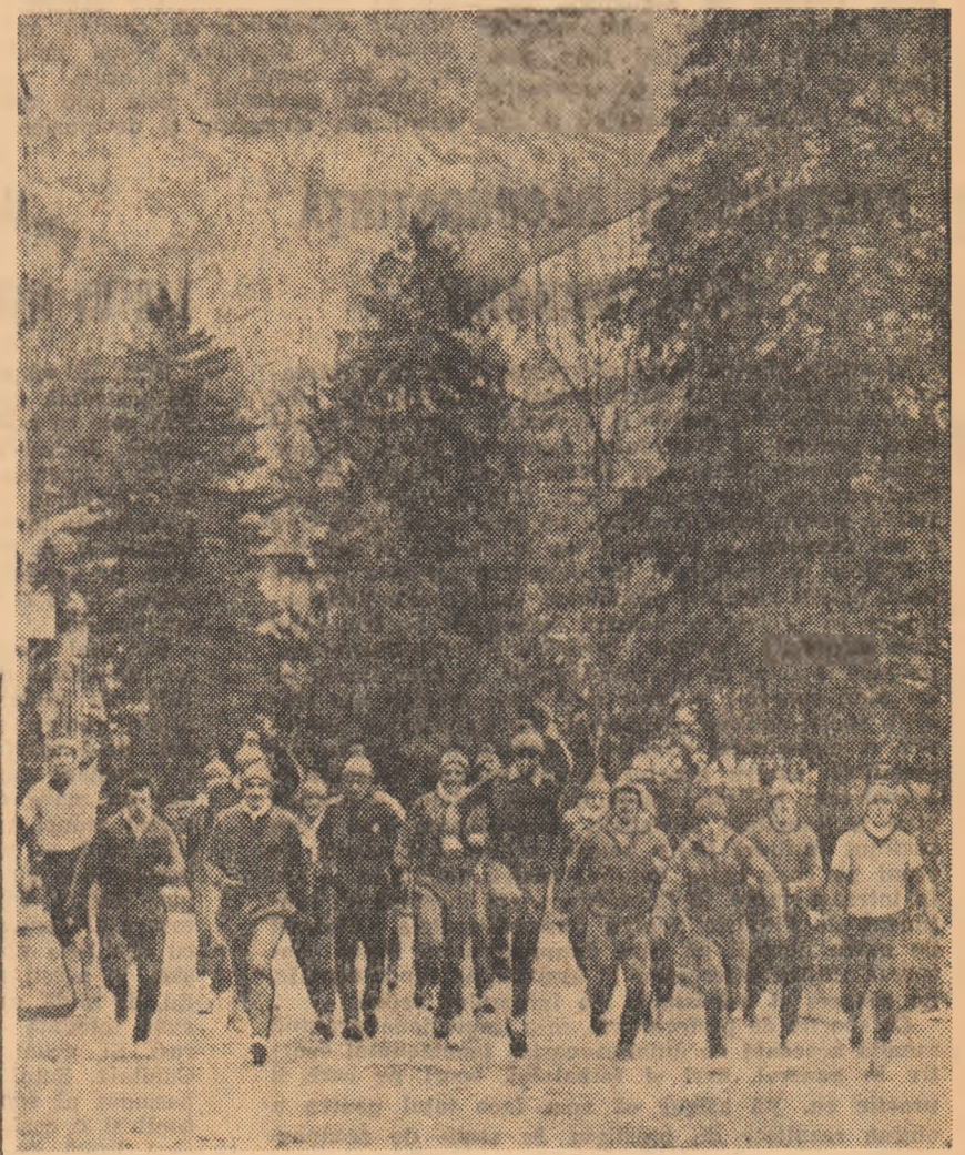
În prima etapă a pregătirilor, la Băile Herculane, toți jucătorii echipei campioanelor, titulari și rezerve, au alergat peste 100 de kilometri cu gîndul remedierii defecțiunilor din toamnă

spuneam că trebuie să luptăm pentru a putea folosi această experiență dobîndită.