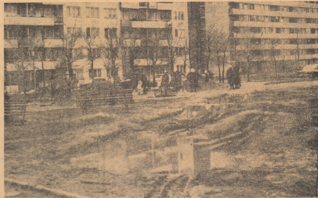
Loc suficient lîngă blocuri pentru terenuri de joacă, lipsește numai inițiativa!

Pînă în prezent, în sectorul 5 s-au amenajat 160 de solari, spații de joacă, baze sportive simple, lucrîndu-se, totodată, la reamenajarea și întreținerea a încă 150 de asemenea terenuri, totalizînd o suprafață de 238.350 mp. Satisfac, oare, acestea nevoile cetățenilor? Raidul nostru anchetei a dus la constatarea că ele sînt încă insuficiente.