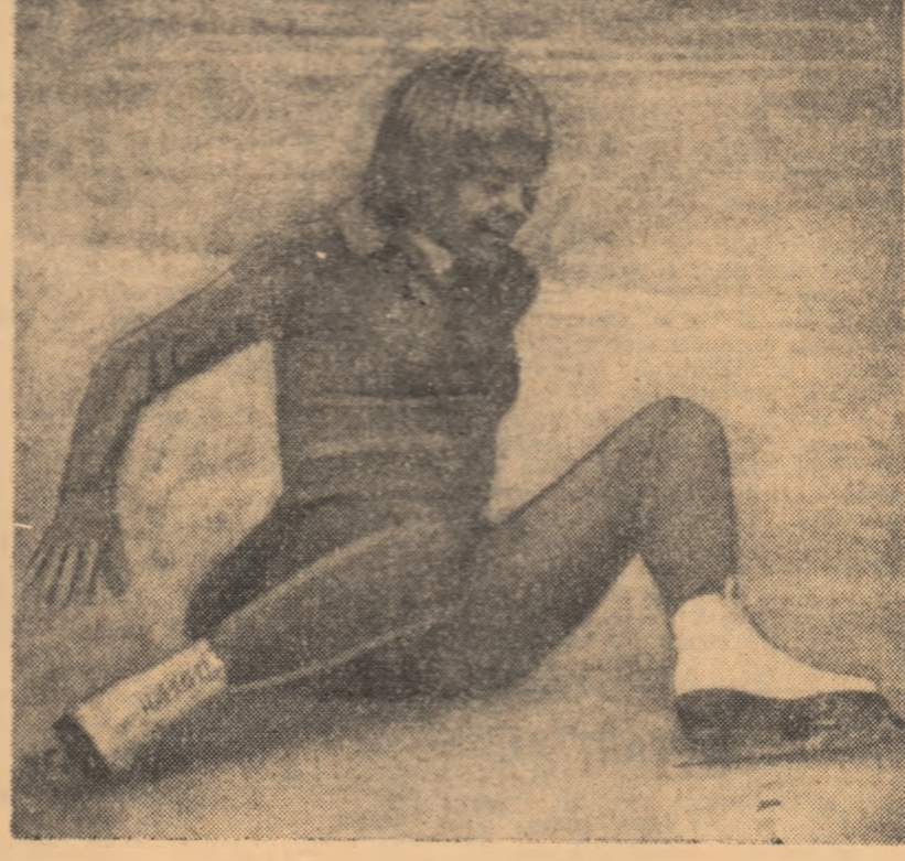
Janet Lynn (S.U.A.), a avut două asemenea accidente la programul scurt, pierzându-și speranțele la titlul mondial.