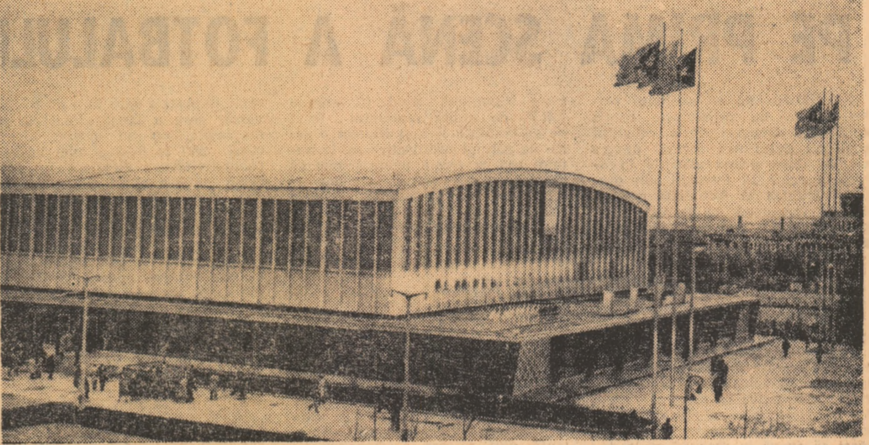
Fațada principală a Palatului sporturilor nautice din Moscova, care va găzdui întrecerile înotătorilor la viitoarea ediție a Universiadei de vară.