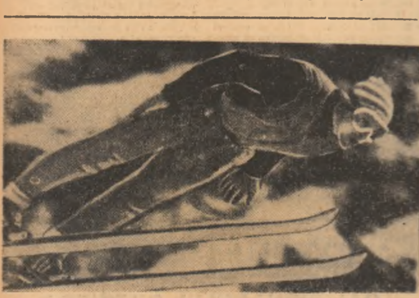
Itați planind deasupra mării trambulina de la Oberstdorf pe noua campion mondial de zbor cu schiurile, excelentul sportiv din R.D. Germane, Hans-Georg Aschenbach. Titlul a fost atribuit pe baza rezultatelor înregistrate în primele două manșe, în care Aschenbach a totalizat 418,5 puncte, avînd sărituri de 157 m și 152 m. A treia manșă a competiției, programată pentru duminică, a fost anulată din cauza timpului nefavorabil.

Echipele de juniori a României pe locul VII. După cum am anunțat, selecționata de juniori la hochei a țării noastre, pregătindu-se pentru a participa la întrecerile grupei B a campionatului european, ce va avea loc la sfârșitul lunii în Olanda, a luat parte la o tradițională competiție, „Cupa Dunării”, ce se organizează anual la Bratislava. La această competiție sînt invitate și joace cele mai puternice echipe de club din Cehoslovacia, precum și unele selecționata naționale de peste hotare. Anul acesta, alături de formațiile cehoslovace, au fost invitate reprezentativele R. D. Germane, României, Elveției și Ungariei.