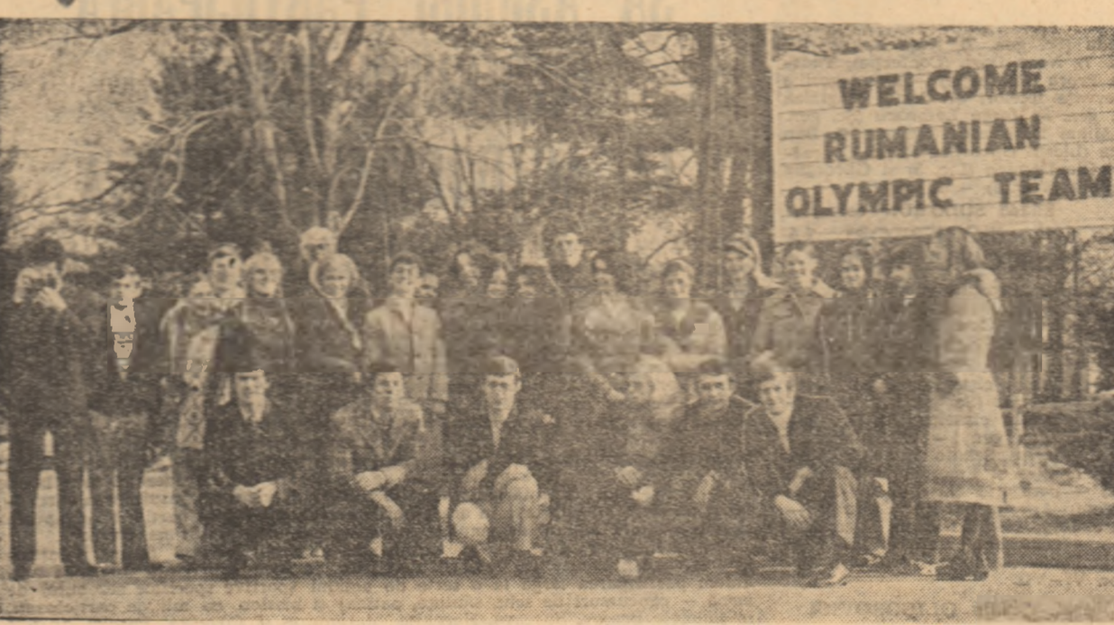
Gimnastii români și gazdele lor de la East Stroudsburg. În fața panoului cu urea de bun venit adresată echipei noastre

Încadrîndu-se disciplinat și cu convingere în programul de activitate stabilite de conducerea delegației și de antrenorii echipei reprezentative de gimnastică ale României și-au îndeplinit onorabil misiunea, bucurîndu-se de călduroasă și măgulitoare aprecieri din partea unor reputați specialiști din S.U.A. a rubricilor sportive din presa americană, a publicului, prezent în număr foarte mare în sălile în care evoluau gimnastii noștri.