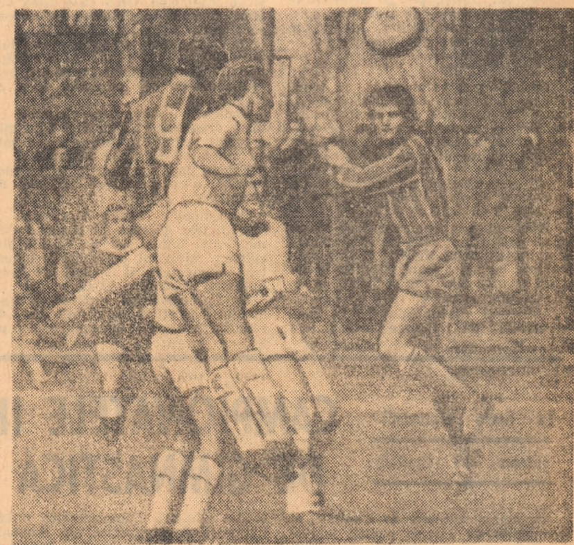
Fază din meciul Progresul București - C.S.U. Galați.