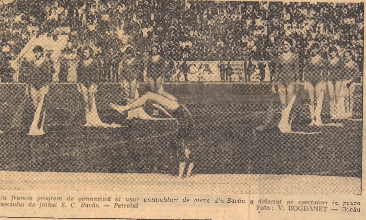
Un frumos program de gimnastică al unor ansambluri de eleve din Bacău a delectat pe spectatori în pauza meciului de fotbal S. C. Bacău — Petrolul

Ieri după-amiază, s-au disputat patru partide restante, contînd pentru etapa a XVIII-a a campionatului feminin de volei. MEDICINA — PENICILINA IAȘI 3-0 (9, 3, 8). De la această partidă așteptam un spectacol de calitate, avînd în vedere cartea de vizită a celor două formații. Dar numai una dintre ele — Medicina — și-a onorat-o. Elevele prof. N. Humă și-au luat de la început rolul în serios și, în ceea ce le privește, au făcut totul pentru salvarea spectacolului. Ele au evoluat bine în toate compartimentele, astfel că victoria la acest scor au meritat-o pe deplin. Din păcate, teșențele nu le-au opus aproape deloc rezistență, fiind impresia că alături de o echipă mult mai modestă decît este creditată în deosebire. Ca urmare, jocul a avut un singur sens și spectacolul a fost realizat doar pe jumătate. Arbitri: F. Szakacs din Baia Mare și Em. Cosoiu din București. (A. B.) UNIVERSITATEA CLUJ — I.E.F.S. 1-3 (7, -10, -4, -14). După un prim set dominat de gazde, bucurytenice evoluează foarte bine, câștigîndu-le pe următoarele, profitînd de căderea clujencilor. Au arbitrat C. Pitar, din Sibiu, și G. Ladislau, din Tg. Mures. (I. POCOL — cores.). ● Vineri, de la ora 18, în sala Dinamo se dispută partida Dinamo — Universitatea Timișoara, contînd pentru aceeași etapă.