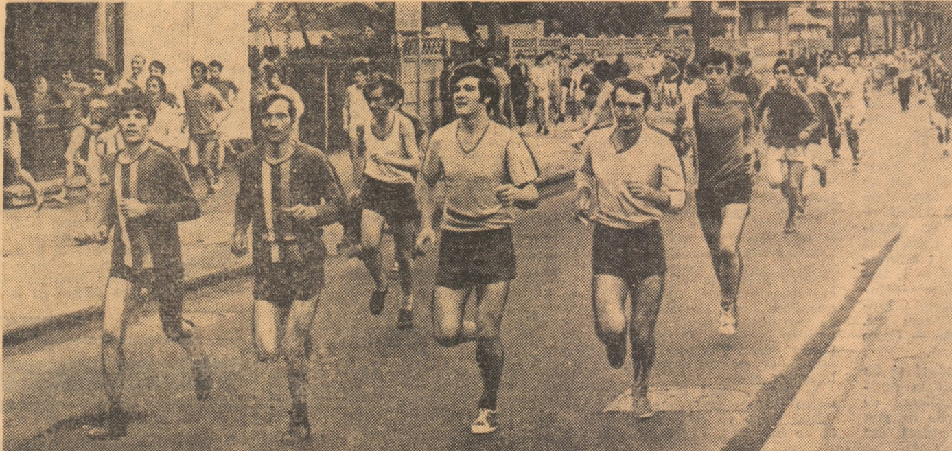
Plutonul — răsfirată după aproape 1 kilometru — parcurge acum calea Griviței.

ANGAJAMENT FERME DE A TRADUCE ÎN VIAȚĂ HOTĂRÎREA PARTIDULUI PRIVIND DEZVOLTAREA MIȘCĂRII SPORTIVE