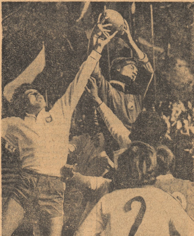
În jocul cu juniorii polonezi, rugbiștii români au fost — după cum se vede și din fotografia realizată de D. NEAGU — superiori în jocul la tușe

Azi, echipele României și Franței păstrează prima șansă în meciurile semifinale