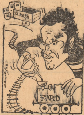
MACRI: - Unu să nu mai scrie! și poate ajung campion din față!