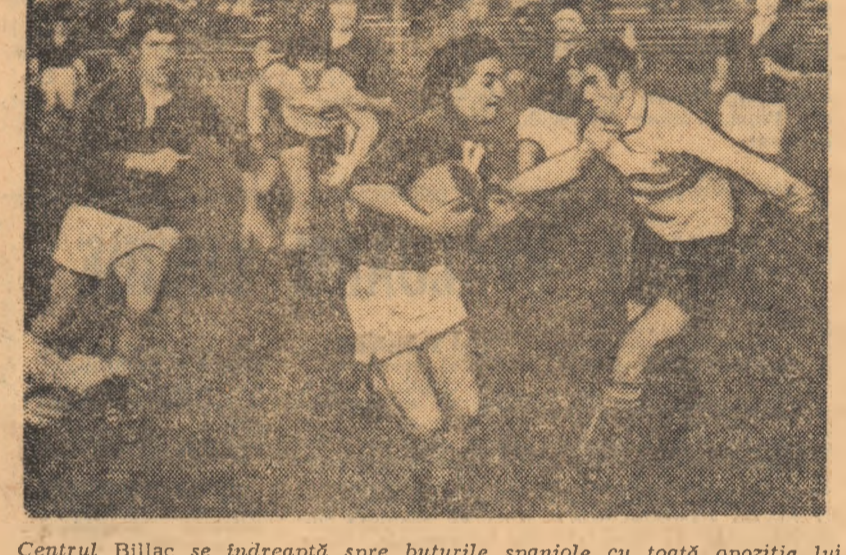
Centrul Billac se îndreaptă spre buturile spaniole cu toată opoziția lui Sese.

POLONIA: Kun — Homa, Szymanski, Milant, Malozewski — Gasiorewski, Targazowski — Glab, Kozak, Blazinski — Wencel, Perayski, A. Czajka, G. Czajka, Gryzb.