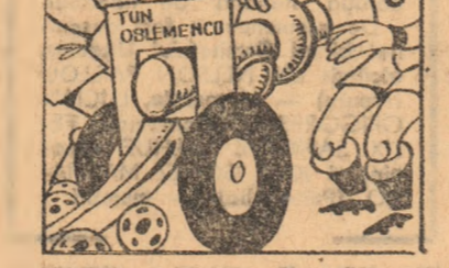
CRETU: - Ce să-ți fac „năruie” mai sînt rezultate ce se înghit cu... noduri!

ATACUL GĂZDELOR SAU APĂRAREA OASPETILOR? Mureșenii în componența atacului jucătorii recunoscuți pentru forța lor ofensivă, în timp ce clujenii se apără excelent, numărîndu-se printre formațiile cu cele mai puține goluri primite în acest campionat. Acest duel - sperăm spectaculos și sportiv - va decide dacă întâlnirea se va încheia, exprimîndu-se în termeni pronosticști, cu 1 sau X.