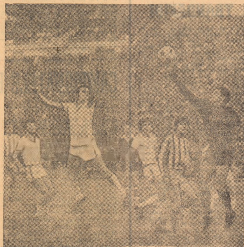
Fază din meciul de cupă S.C. Baică — Rapid. Portarul Ghiță respinge balonul ce se îndrepta spre buturile sale. De reținut tribuna gălățeană, arhiplină.