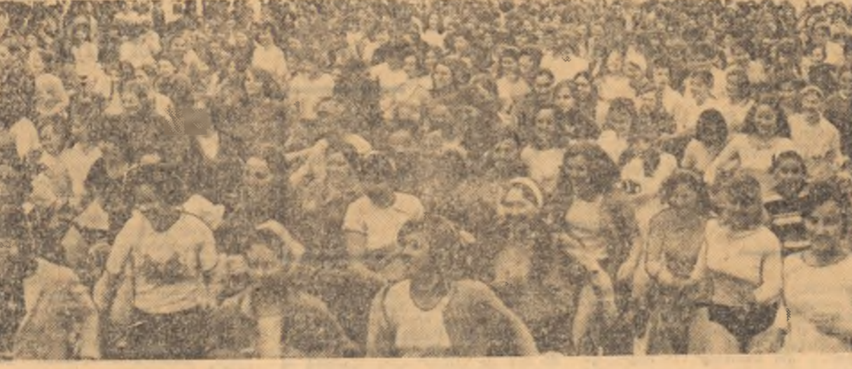
Această primăvară a coincis cu relansarea uneia dintre cele mai simple și mai accesibile forme de practicare a sportului: crosul. O imagine de la una din numeroasele întreceri ce au avut loc în Capitală

DUMINICĂ VA AVEA LOC O MARE SERBARE SPORTIVĂ Duminică dimineața, cu începere de la ora 9, la școala generală 204 din cartierul Drumul Taberei, va avea loc o mare serbare sportivă școlară. După festivitatea de deschidere, va urma un bogat program