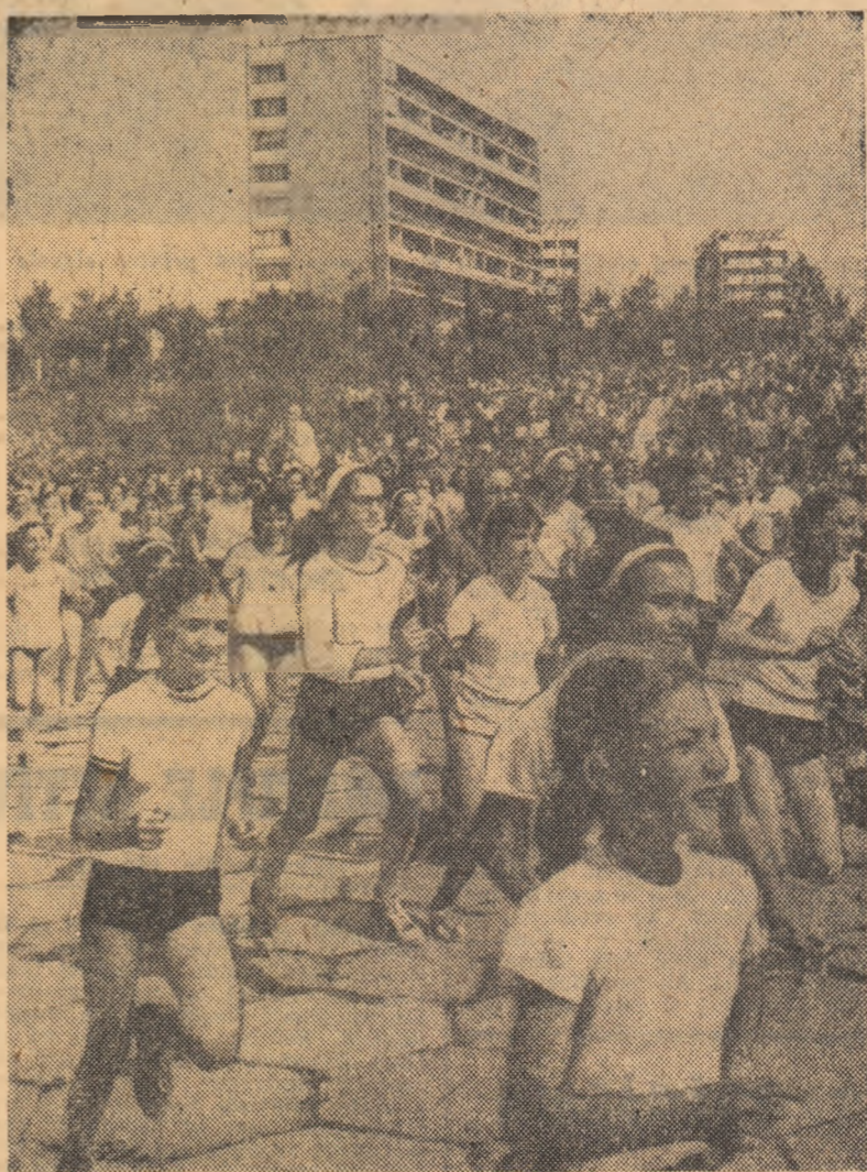
Vacanța, prilej de noi întreceri pentru copii...