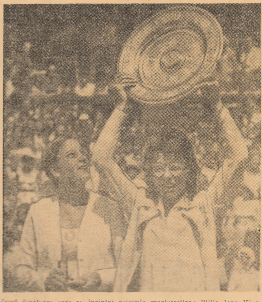
Doamni jucătoare care au încetat privirile spectatorilor: Billie Jean King (dreapta), triplă campioană, alături de învingătoarea sa în finala de simplu, Chris Evert, totuși lideră distanțată în Marele Premiu F.I.L.T.