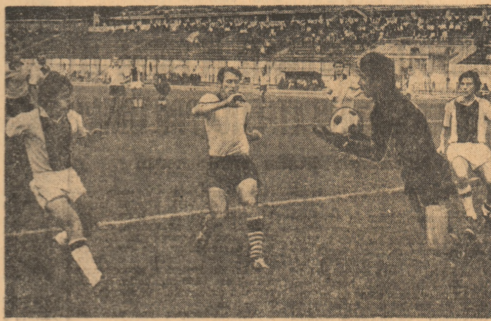
Itat un spectaculos duel din campionatul studentesc, între două echipe din București.

Cuplajul începe la ora 18, pe stadionul „23 August”