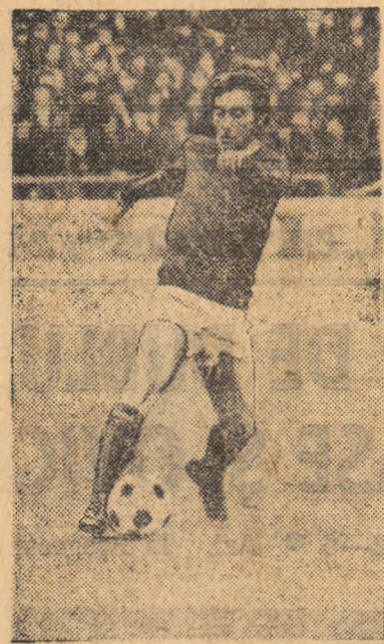
Piteştiul sportiv este astăzi în sârbătoare; iubitorii de fotbal — şi nu numai ei — aniversază festiv două decenii de existenţă a echipei locale FOTBAL CLUB ARGES — o prezenţă binecunoscută (şi dorită) pe stadioanele noastre. De fapt, F.C.

Argeş există doar de la 1 martie 1968 când, la Piteşti, s-a constituit primul club de fotbal din ţara noastră. Dar la 6 august 1953 în campionatul oraşenesc Piteşti debutează o echipă nouă: Dinamo. E, de fapt, data de naştere a actualului F.C. Argeş.