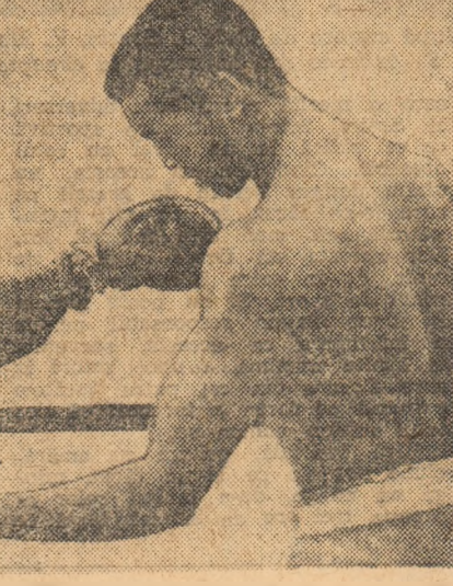
Teofilo Stevenson, la unul din antrenamentele sustinute în compania altui campion olimpic, Emilio Correa

k.o. şi în faţa lui Ion Alexe. Este un boxer nu prea înalt dar care loveşte năpraznic. — Vreţi să descrieţi meciul? — Partida a început calm. După aproximativ un minut, campionul