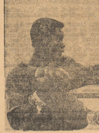
Teofilo Stevenson, la unul din antrenamentele sustinute în compania altui campion olimpic, Emilio Correa

Săptămîna trecută, la Santiago (Cuba), a avut loc un mare turneu internaţional de box. În oraşul aflat la 1000 de km de Havana şi-au dat întâlnire pugilişti din numeroase ţări ale lumii, printre care