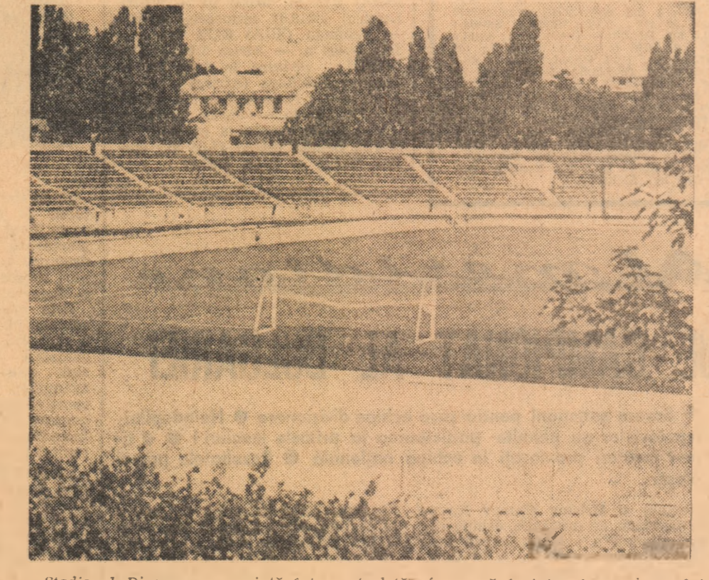
Stadionul Dinamo se prezintă într-o „toaletă” frumoasă înainte începerii noului sezon competițional.