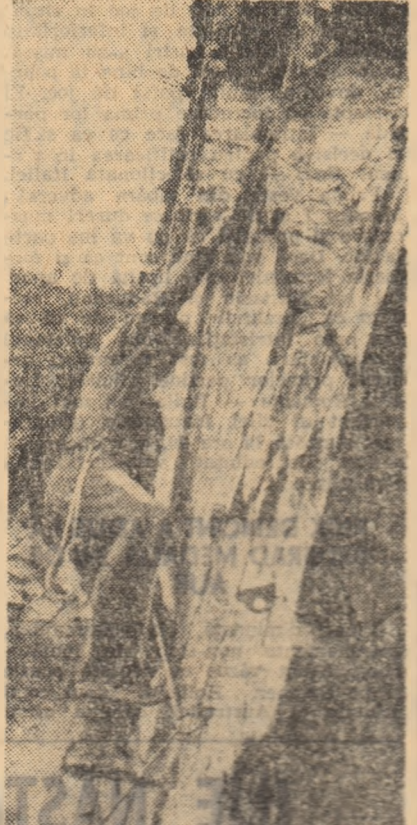
Intărind să cucerească înălțimile pe teritoriul parcului de stație, tinerii se deprind să-și asume sarcini fizice și să-și însușească tehnica de urcare...