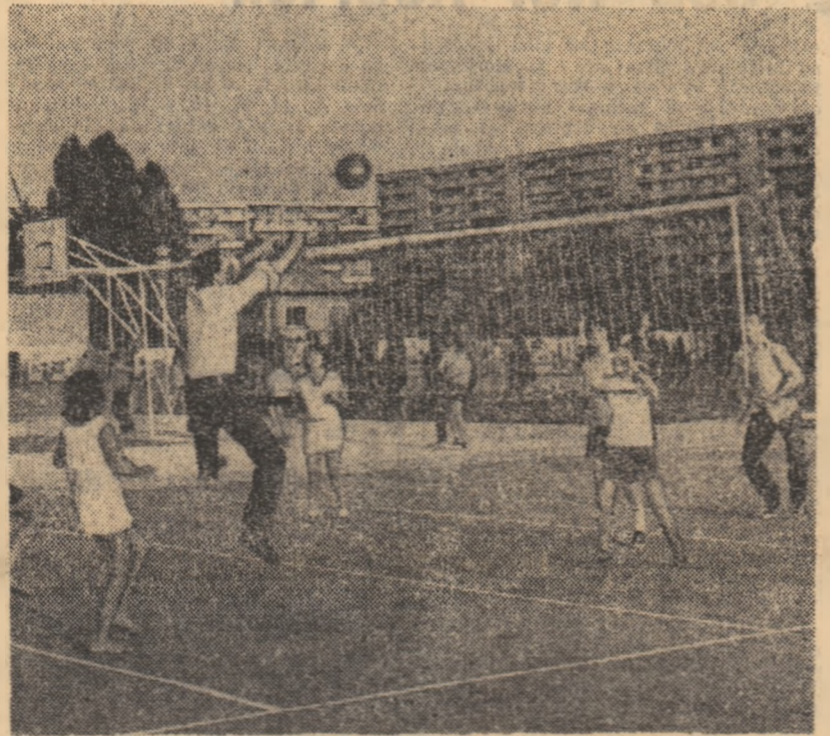
Ieri după-amiază, pe terenurile bazei sportive „Voinicelul”, animația caracteristică.

Privit de la înălțimea zborului păsărilor, de pe platformele blocurilor turn care străjuiesc Bulevardul Muncii, sau strada caporal Ruciță, de la „portile” cartierului Balta Alba, complexul sportiv pentru copii „Voinicelul” își incită privirea prin polihromia terenurilor sale, prin curgînta desăvîrșită, prin forțata juvenală care nu conține de dimineață pînă seara. Sectorul 4 s-a îmbogățit de o săptămînă cu o bază sportivă unică nu numai în Capitală, dar — probabil — în întreaga țară. Ea s-a născut din entuziasmul și hărnicia cetățenilor acestei foarte populate zone bucureștene, care au căpătîit din partea Comitetului de partid, a Consiliului pentru educație fizică și sport și a altor organizații cu atribuții în acest domeniu, a conducătorilor marilor unități economice din sector un puternic sprijin moral și material, reușind să aducă la bun sfîrșit o acțiune ce merită toate elogiile.