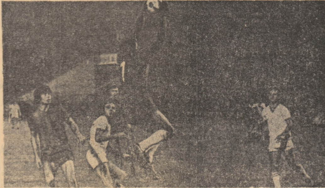
Întîlnirea Steaua — Rapid au fost mereu atractive, așa cum sperăm să fie și partida de mîine de pe stadionul „23 August”. În instanțanul realizat de fotoreporterul nostru Dragoș Neagu, o fază de la unul din meciurile din campionatul trecut, încheiat cu scorul de 1-1.

Dar despre pregătirile și alte elemente asupra celor două partide ale etapei de mîine, citii amănunțit în pagina a III-a.