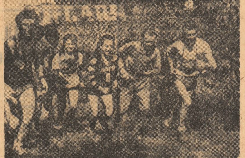
Plecarea în concurs de orientare (Oradea)

ȘI ÎN COMUNELE JUDEȚULUI IAȘI... ...ca de altfel pretinzîndi în țară, se pune un mare accent pe dezvoltarea sportului. În această vară peste 30 de asociații sportive săsești din județul Iași au primit mese de tenis. În multe localități au luat naștere adevărate șantiere unde tineri — mai ales — și vîrstnici, au lucrat cu multă trăgere de inimă la amenajarea unor baze sportive. După o campanie reușită