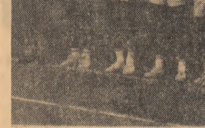
Înainte de startul în „naționalele” de seniori s-a încheiat campionatul de juniori...