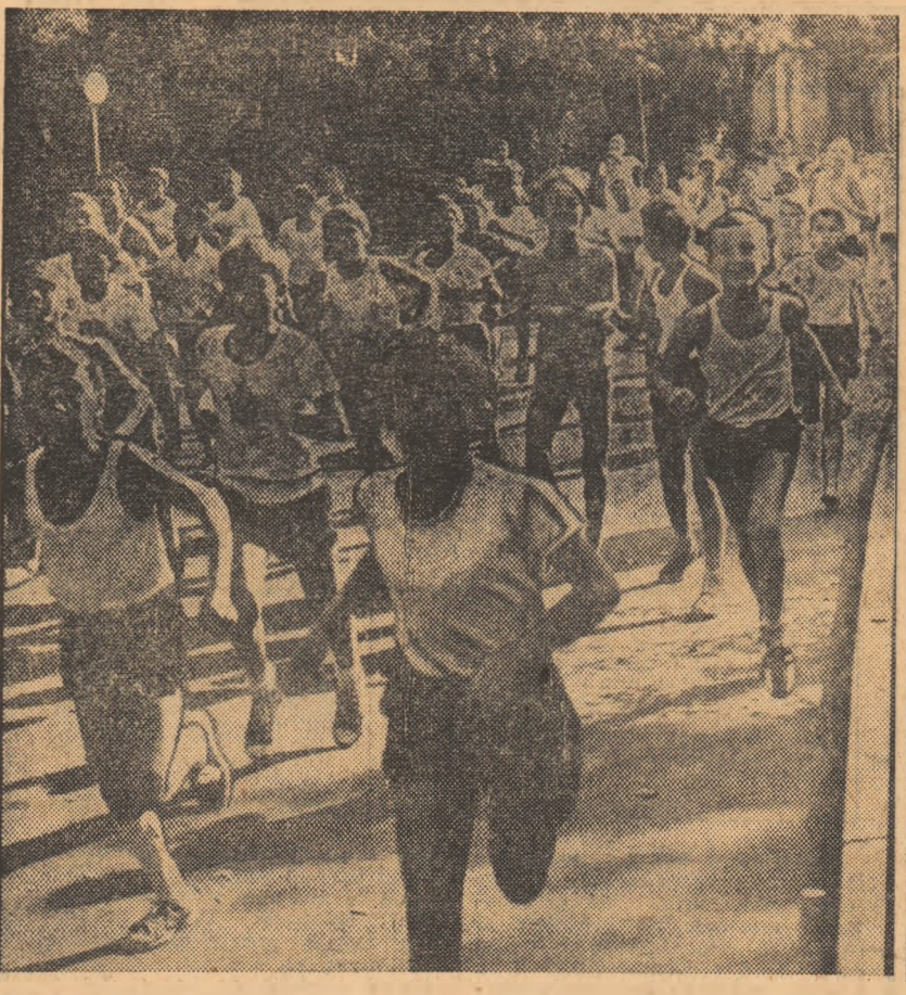
Seria crosurilor populare deschise amatorilor bucureșteni continuă în aceste zile. Iată un aspect de la o asemenea acțiune desfășurată în sectorul I