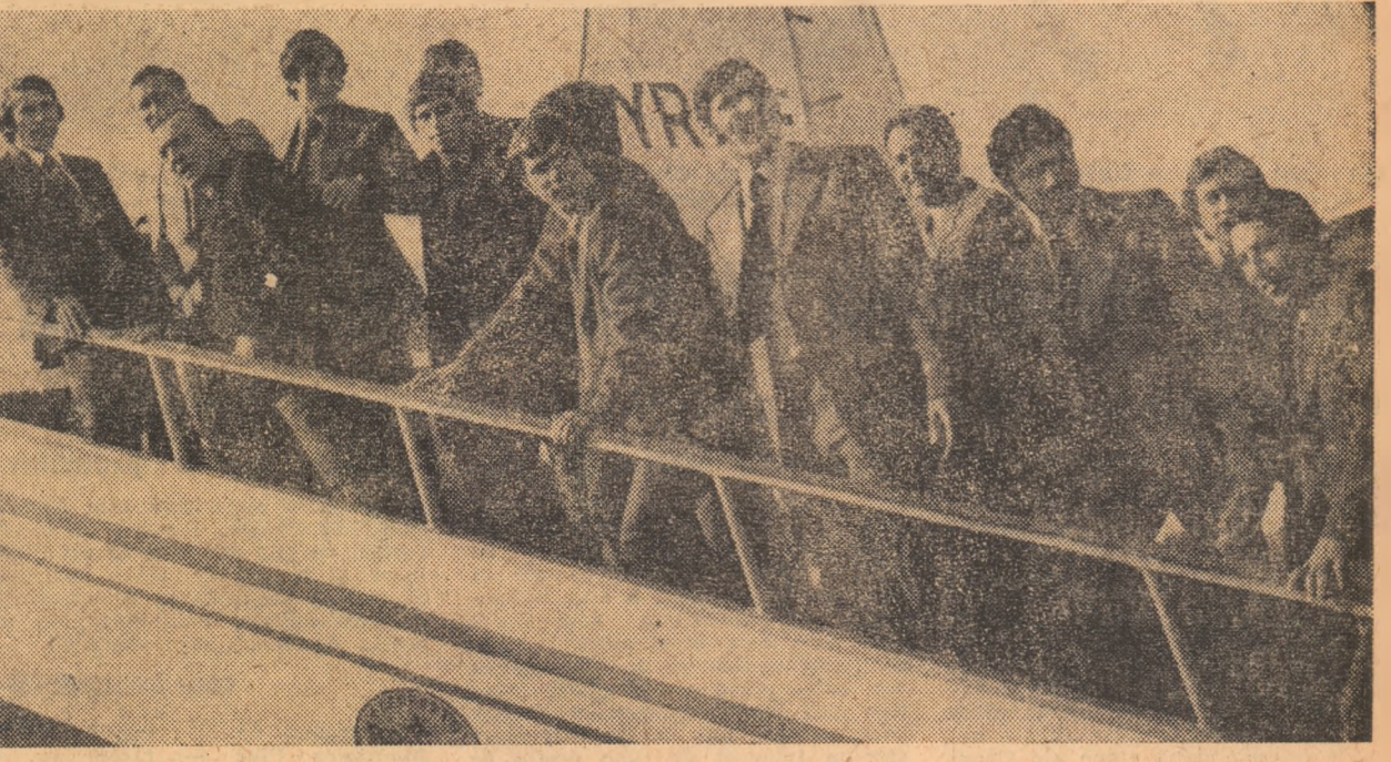
Pe scara avionului, cu câteva clipe înainte de decolare.