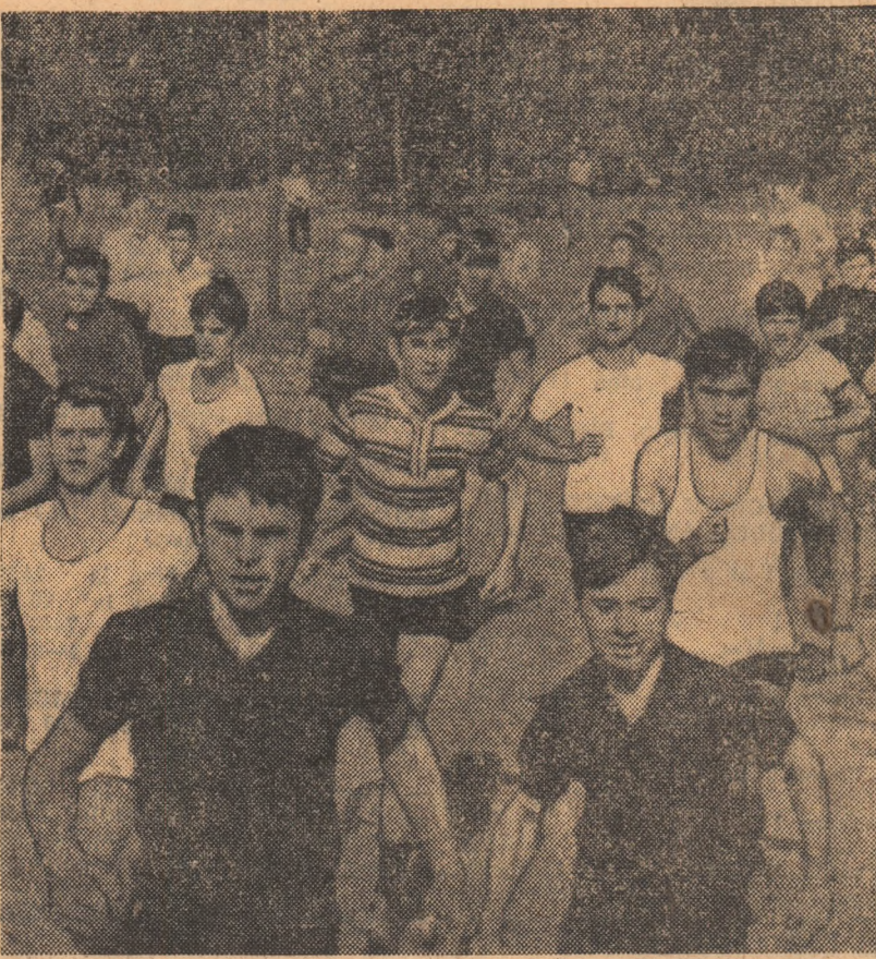
Întrecere pasionantă în cadrul uneia dintre categoriile băieților participantei la „Crosul de toamnă” al sectorului 7

Stadionul Avintul, terenurile de sport, sălile cluburilor din Reghin,