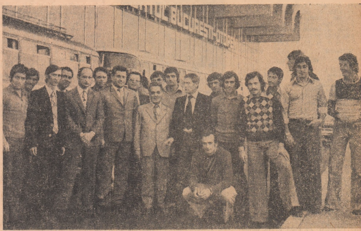
Echipa Fiorentina, la cîteva momente după sosirea pe aeroportul internațional Otopeni, de unde a plecat imediat, ieri, după-amiază, cu autocarul, spre Craiova.

Iată-ne în ajunul unei noi „mișcări de joc“. Mîine, ce țîlce de pe întregul continent, și iubitorii de sport de la noi vor trăi febrile momente din cupele europene devenite eveniment de primul ordin în viața fotbalului. În partidele monșiei a doua, trei dintre formațiile noastre vor juca în fața propriilor suporteri. Două dintre ele pleacă cu bune premise de calificare — Dinamo și Universitatea Craiova, F. C. Argeș — a treia reprezentantă a soccerului nostru, care miine beneficiază de avantajul terenului, are în față handicapul a patru goluri, dar ea e și specialistă a unei asemenea probe, așa că nutrim speranțe că va face totul spre a repeta „episodul Toulouse“. A patra formație românească prezentă în competițiile europene, Chimia B. Viteaz, se va găsi, mîine, în Belfast, în fața celui mai dificil meci din țîna sa activitate internațională. Ascensiunea de formă o „unsprezecelea“ revelație al sezonului trecut, ne permite să credem într-o comportare onorabilă a actualei detinătoare a „Cupei României“, în sfîrșit, A.S.A. Tg. Mureș dispută la Sofia returul finalei „Cupei Balcanice“. Ieri a fost ziua soarelui și plecărilor o forță în atmosferă. Despre acestea vă informăm scurtele reportaje care urmează.