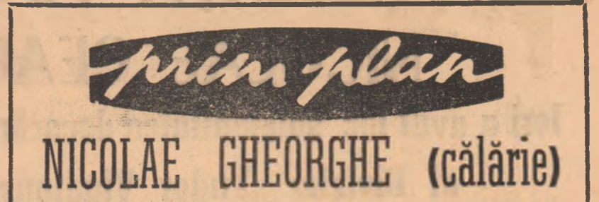
S-a născut la Ploiești, la 12 martie 1935. Are 1,72 m înălțime și o greutate de 48 kg.

„SPORTUL” - PE AGENDA EDILIILOR ORĂȘULUI