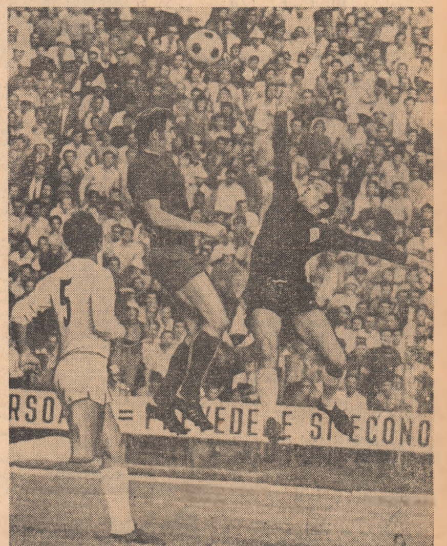
Portarul italian Superchi și Bălan într-un spectaculos duel pentru minge, urmărit îndaproape de către Brizi — în tricou alb, cu numărul 5 (Faza din meciul Universitatea Craiova — Fiorentina)

punînd la grea încercare, ca și în meciul de duminică cu F. C. Constanța, nervii celor peste 35.000 de spectatori — și în împrejurări care au dat naștere la multe discuții (și la unele incidente neplăcute în teren și pe marginea lui), succesul Universității este întru totul meritat, îndeosebi pentru evoluția ei din repede secundă, cînd a dominat cu insistență și a fost cel puțin în alte două rînduri (la „bara” lui Oblencov și splendidă pătrundere a lui Mavru) foarte aproape de a deschide scorul. Apreciîndu-i călduros pe jucătorii craioveni și pe antrenorul lor pentru această prețioasă și prestigioasă reușită — a cărei semnificație se răsfrînge asupra întregului fotbal românesc — considerăm necesar să subliniem și alte aspecte care au legătură directă cu acest