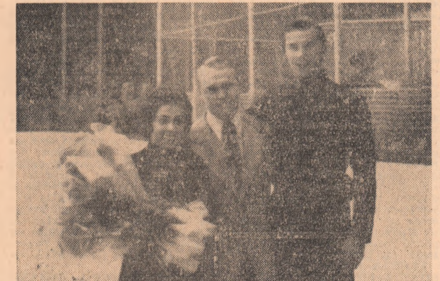
Cuplul campionilor mondiali, Irina Rodnina și Aleksandr Zaitsev, împreună cu antrenorul lor, Stanislav Juk.