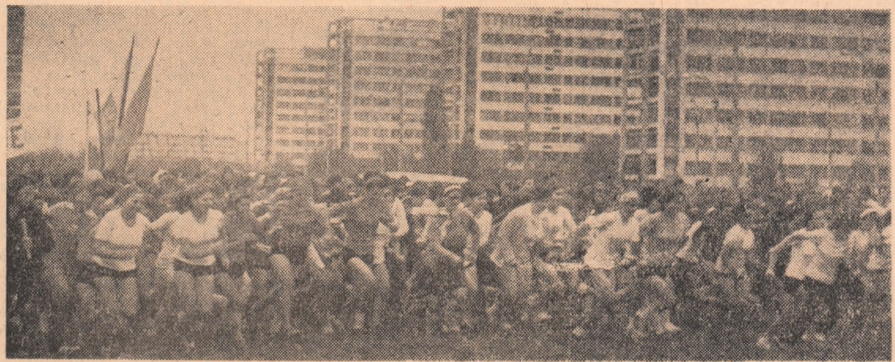
Start în cursa rezervată tinerelor de la categoria de vîrstă 17-18 ani. Au alergat în cursa de 1000 m peste 500 de fete, toate dornice să obțină tichetul de „Participant la cros”.

Duminică dimineață. Cartierul Titan. Soarele continuă să rămână ascuns după nori, dar frigul nu i-a putut împiedica pe cei peste 10000 de tineri din Capitală să fie prezenți, exact la ora stabilită, la locul de întîlnire. Elevii ai școlilor generale, ai liceelor și ai școlilor profesionale, studenții (cei mai mulți de la Institutul agronomic Nicolae Bălcescu), muncitorii de la I.O.R., Electroaparat, de la Telefoane și de la Combinatul poligrafic Casa Școlitei — au participat la marea carnaval cultural-sportiv, organizat de Comitetul de partid al Sectorului IV și de Consiliul pentru educație fizică și sport, în colaborare cu Comitetul U.T.C. și Consiliul organizațiilor pionierilor.