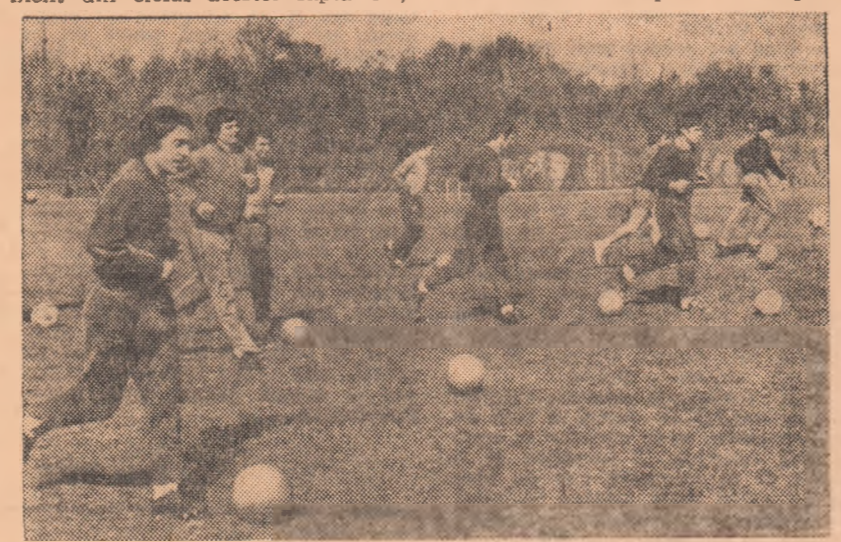
O bună parte din exercițiile cu conținut fizic au fost executate, cum rezultă și din fotografia de față, în toatășia balonului.

Pe terenul său, din bulevardul Ghencea, Steaua a efectuat, ieri dimineață, cel de al doilea antrenament din ciclul acestei săptămîni.