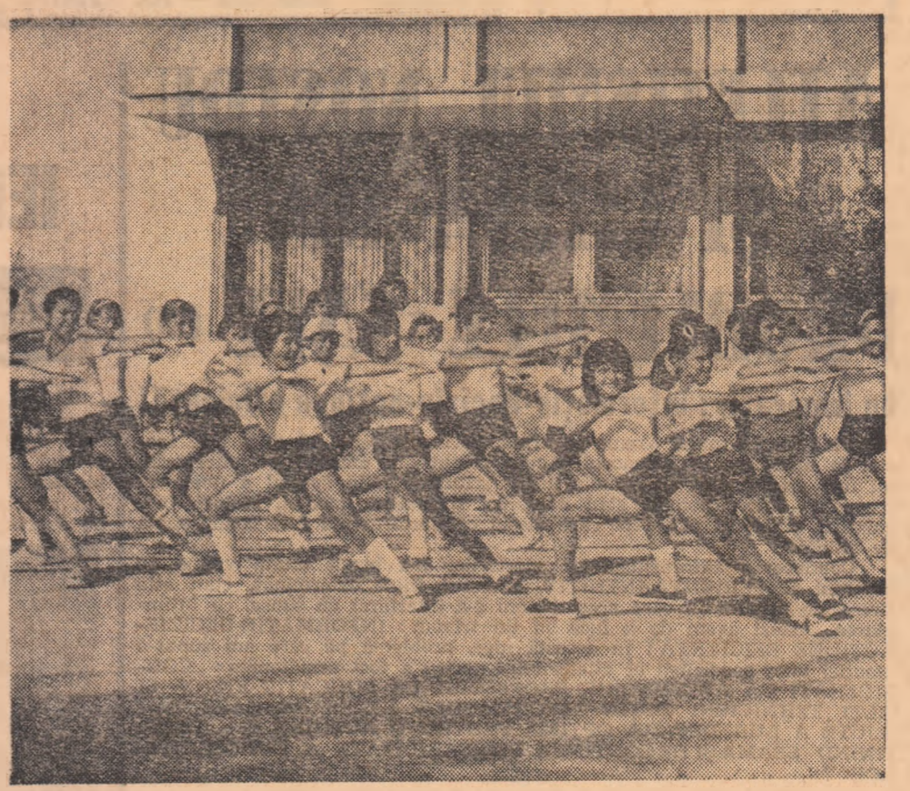
Organizarea „reprezilor” de gimnastică în școlile generale preocupă tot mai mult cadrele de specialitate. Ea tinde să intre în programul fiecărei unități de învățământ cu ciclu primar sau gimnazial

care lucrează îndeplinesc normele și dacă la celelalte elemente care definesc criteriile stabilite, aprecierile sînt foarte bune și bune.