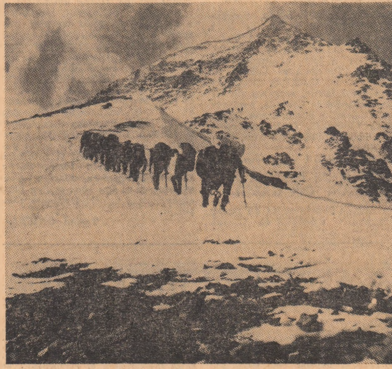
Aspect dintr-o ascensiune a alpinistilor sovietici spre unul din virfurile Pamirului.

nismul sovietic au fost introduse categoriile sportive. Actualmente există 50 de maeștri emeriți ai sportului. În rîndul lor se numără Vitali Abalakov, cunoscutul con-structor, care și acemicianul Av-gust Letavet, laureat al Premiului Lenin. Nu mai puțin de 1 140 de alpinisti au obținut titlul de maes-tru al sportului. Numeroși oameni de știință, laureați ai premiilor de stat, ca și eroii al muncii socialiste, se alină în rîndul acestora. Prima pas pentru obținerea categoriilor este făcut prin trecerea normelor care dau dreptul de a purta insigne de „Alpinist al U.R.S.S.”. După normele de clasificare există șase categorii de alpinisti.