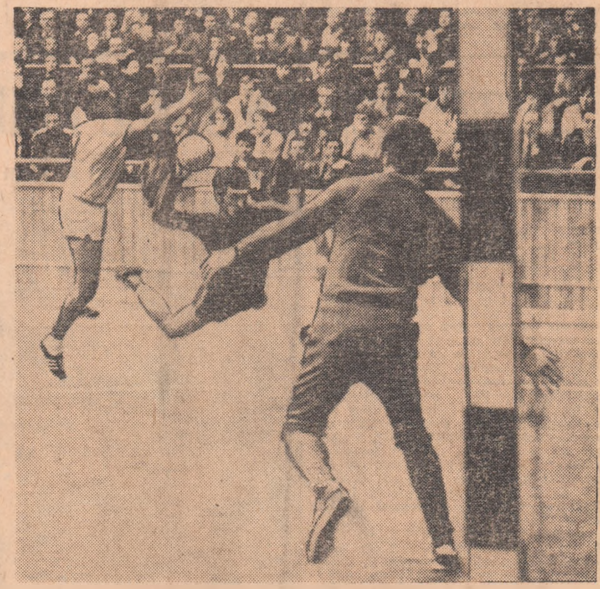
Fază din jocul României înscris — R. D. Germană, desfășurat în cadrul ediției trecute a „Trofeului Carpați”

În fond acesta este cazul și cu a XIV-a ediție a „Trofeului Carpați” la startul căreia — așa după cum am subliniat într-un material anterior — sunt prezente primele patru echipe, aflate în fruntea listei favoriților întrecerii pentru titlul suprem. Este vorba de selecțiile Iugoslaviei, R.D. Germane, Uniunii Sovietice și, firește, României. Dintr-un grup de patru formații, la Cluj, reprezentativa sovietică va fi prezentă fără nici o... fisură, aliniind cel mai puternic și omogen team din acest sezon. Este, deci, pentru prima oară când handbaliștii sovietici se vor prezenta la o întrecere cu garnitura completă, așa cum o vor face, probabil, la apropiata ediție a C.M. lată un fapt demn de subliniat, deoarece el probează că deficiențele lotului pentru C.M. este gata și că în viitor nu se va urmări decât rodarea și omogenizarea formației. Și acum lotul so-