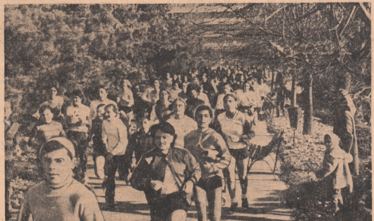
„CROSUL FETELOR” din Sectorul II al Capitalei s-a bucurat de mult succes printre tinerete din asociațiile sportive ale întreprinderilor și instituțiilor. În instanțea surprins în timpul desfășurării cursei, pe cele din preajma Circuitului de stat.